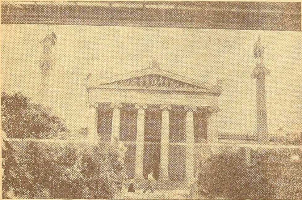
На фото: будинок Академії наук в Афінах.

На весь світ славиться краса Неаполітанської затоки, але на цей раз природа виявилась непривітною — затоку вкрив туман, і крізь нього ледве-ледве проступали силуети міста, а красуня Везувія зовсім не було видно. Чим ближче підходить «Побера» до Неаполя, тим все ясніше і ясніше вимальовується амфітеатр великого міста, його будинки білого, жовтого, червоного та сірого кольору, силуети кораблів біля пристаней, громада старовинного замку Кастель-Ово, що стоїть біля входу в порт. Є в Неаполі морський пасажирський вокзал, побудований спеціально для обслуговування іноземних туристів. Для