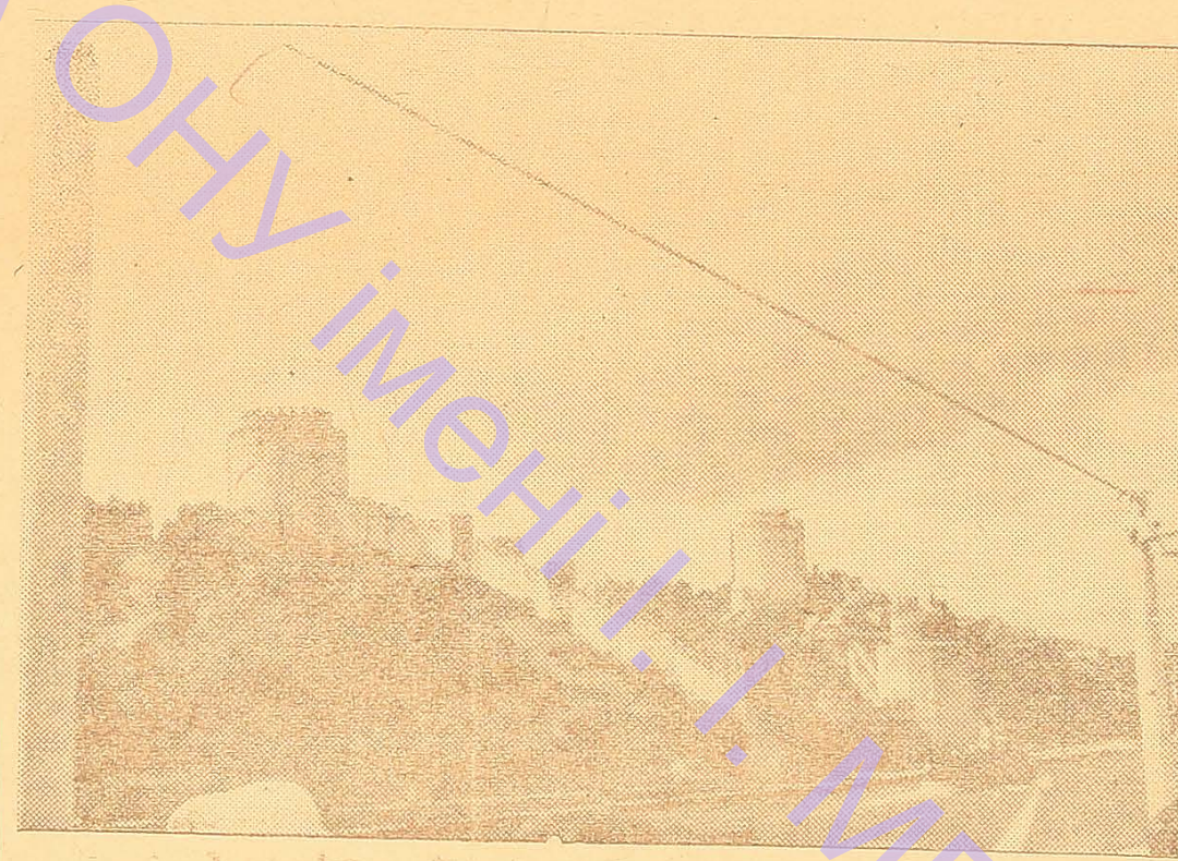
На фото: фортеця Румеліхисари

Є в Афінах і пам'ятник епохи римського володарства. Нам показували залишки храму Зевса Олімпійського, побу-