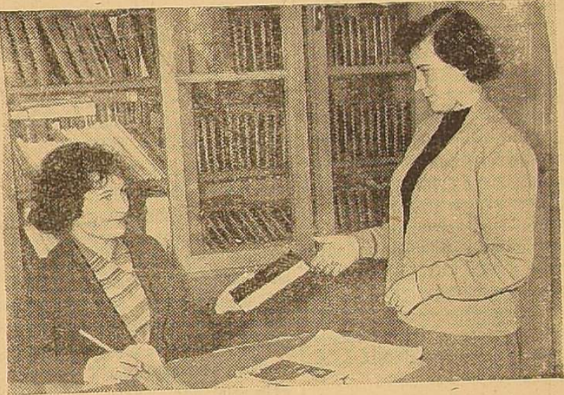
На фото: в кабінеті історії КПРС.

Субота... Закінчилась остання лекція, але ніхто із студентів I курсу історичного факультету не поспішає додому. Через півгодини вони вже на підшефному заводі ім. Січневого повстання у своїх друзів — робітників механічного цеху. Молоді робітники, які борються за те, щоб їх бригади називалися комуністичними, не лише добре працюють, перевищують норми, вчать. Вони все