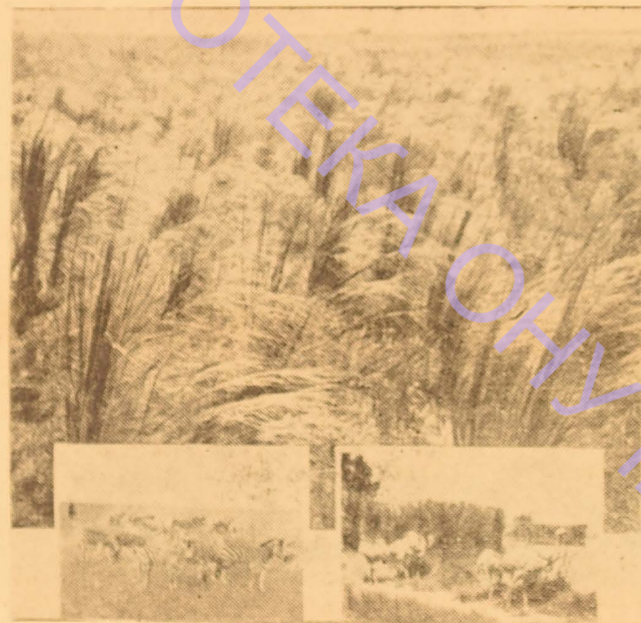
Африканські зебри в заповідному цілинному степу.