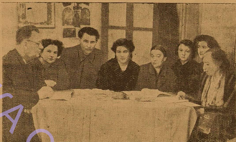
Велику користь приносять практикантам аналізи проведених уроків, в яких беруть участь викладачі школи та керівники практики. На фото: обговорення уроку в 105 середній школі.

24-го лютого відбулася методична конференція, на якій методисти і викладачі кафедри педагогіки детально розповіли студентам значні прогалини в математичній підготовці. Потрібно сказати, що значну допомогу нашим практикантам подають досвідчені вчителі шкіл.