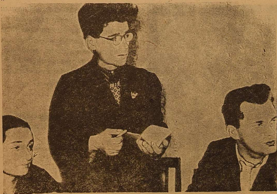
Иде засідання редакції.