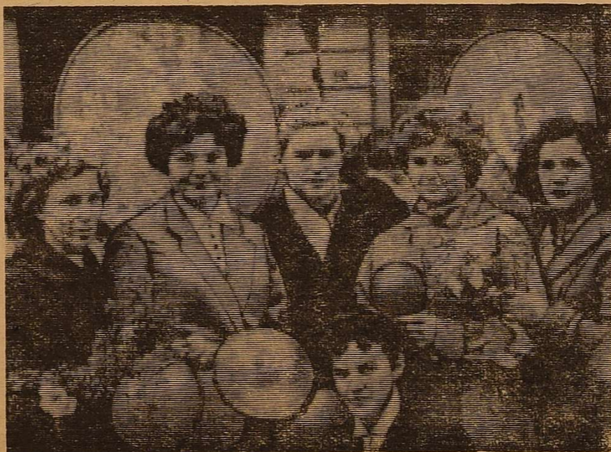
Радісно і урочисто відзначили Першотравневе свято студенти та співробітники нашого університету. В день міжнародної солідарності трудящих вони ще раз продемонстрували свою згуртованість і відданість рідній Комуністичній партії і Радянському уряду.