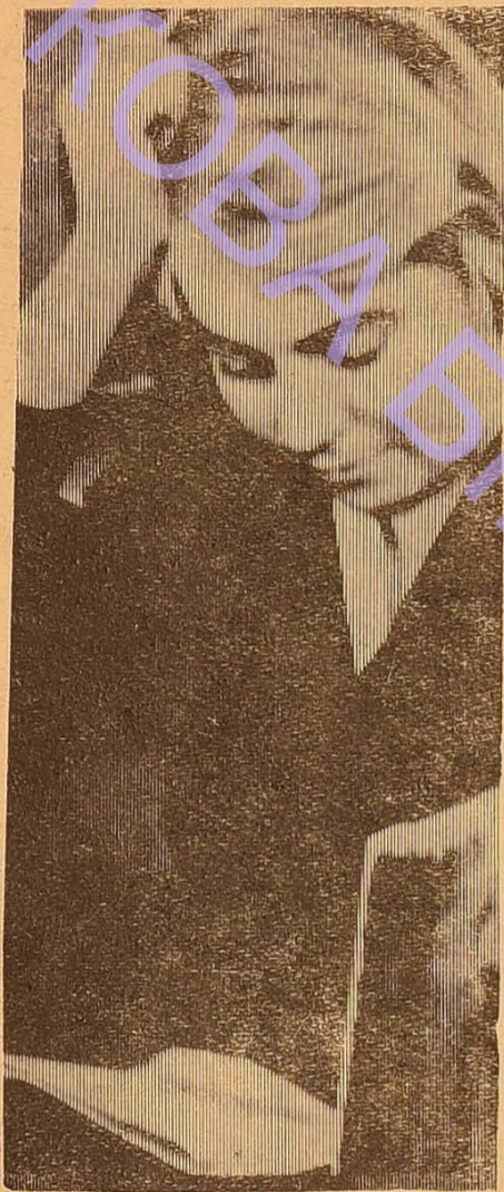
Попереду останній екзамен.