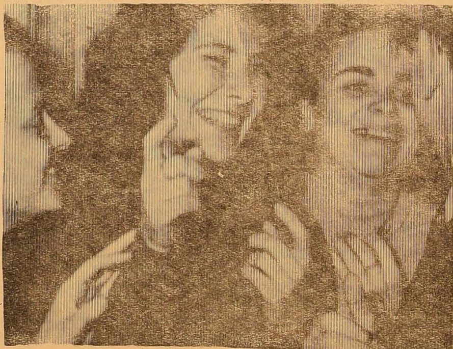
— Кореспондентів не пустимо!..