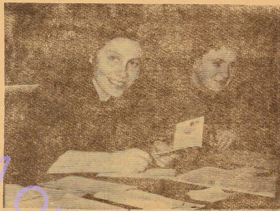
...як посміхається подруга. Відмінно!