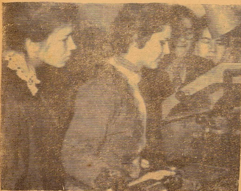
На фото: студенти I курсу хімічного факультету складають залік з практикуму в майстернях університету.

На піднесенні пройшли іспити й на інших курсах. Єдиним недоліком в цей день було те, що ряду груп іспити довелося складати «в другу зміну». Очевидно, жодна з методик не передбачає подібної практики, і деканатові слід це врахувати.