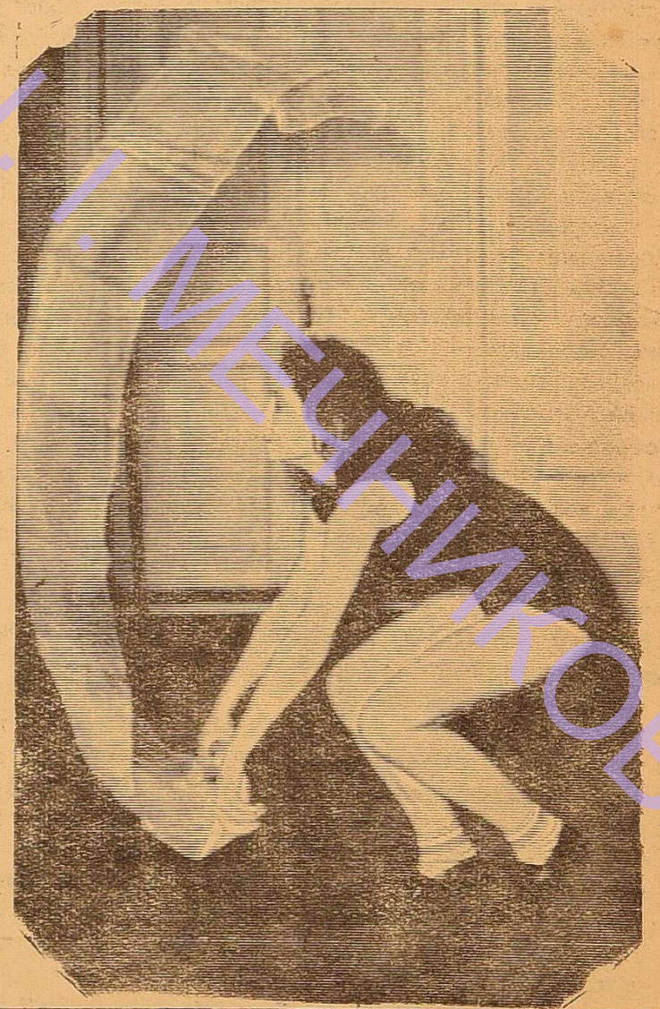
В спортивном зале университета под час зимових каникул не припинялися тренування спортсменів з спортивною та художньою гімнастикою та з інших видів спорту.