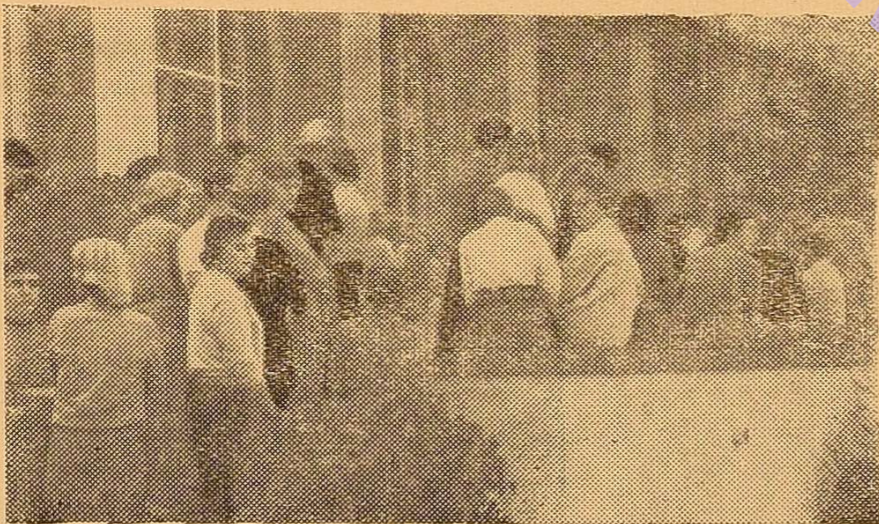
На фото: В Станфордському університеті.

Бували ми й на домашніх прийомах у деканів та професорів університетів, а також у приватних