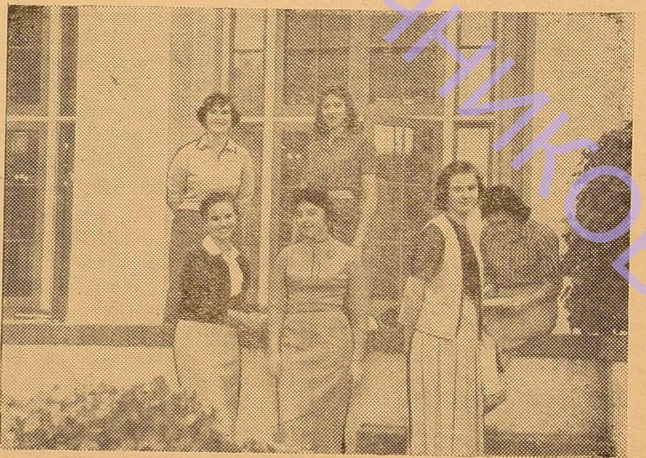
На фото: студенти Станфордського університету

Навчання в американських університетах платне (1000—2000