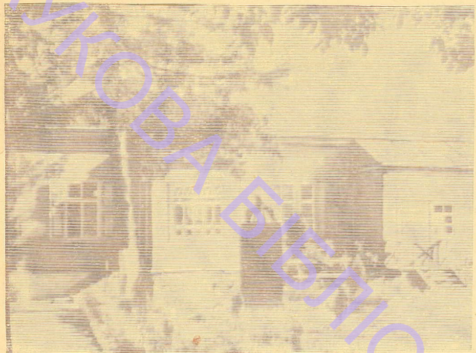
Будинок-музей М. М. Коцюбинського.