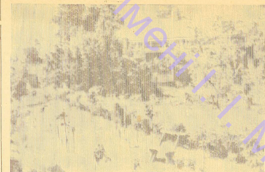
В саду біля будинку-музею М. М. Коцюбинського.

Під час обговорення доповідей виступила студентка V курсу Ва-