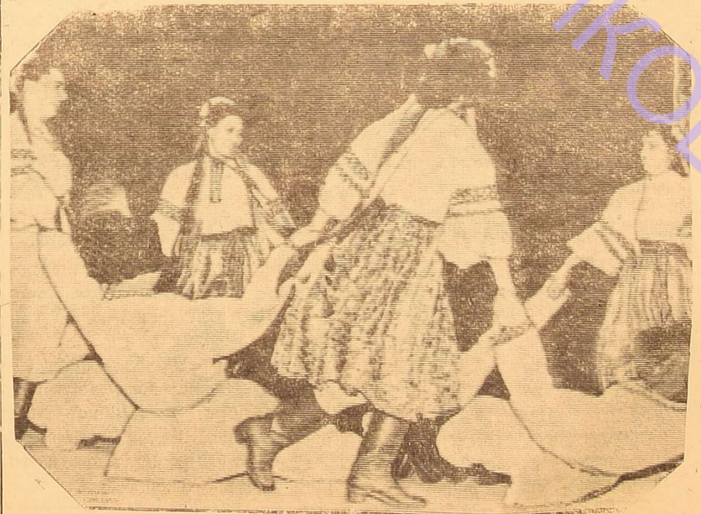
Танцювальний колектив виконує буковинську «Молодіжку».