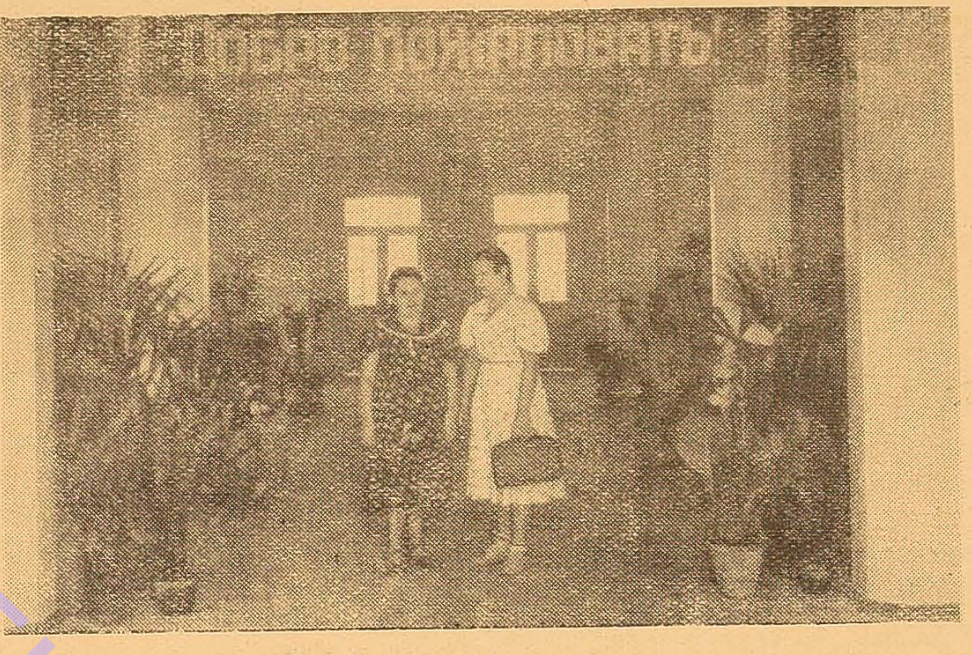
Великі кошти витрачаються в нашій країні на будівництво нових учбових закладів і розширення існуючих. В цьому році вступив до ладу новий корпус біологічного факультету нашого університету. На фото: Вестибюль нового корпусу біологічного факультету.