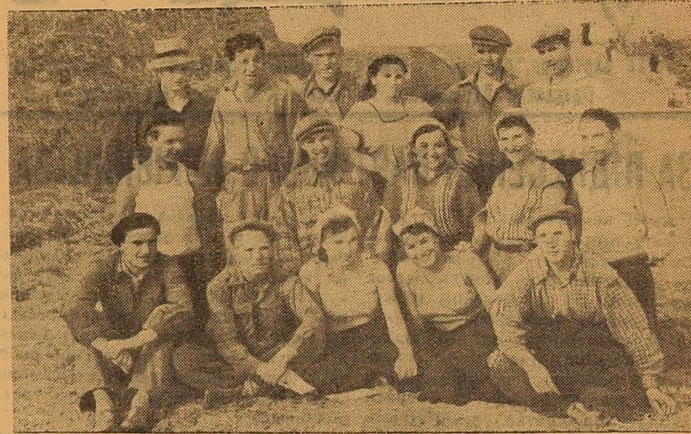
Комсомольська група II курсу геолого-географічного факультету