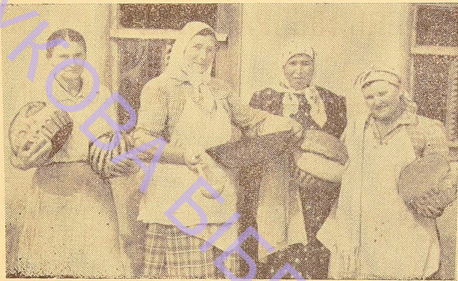
На фото: куховарки колгоспу ім. Молотова, с. Баланіни.