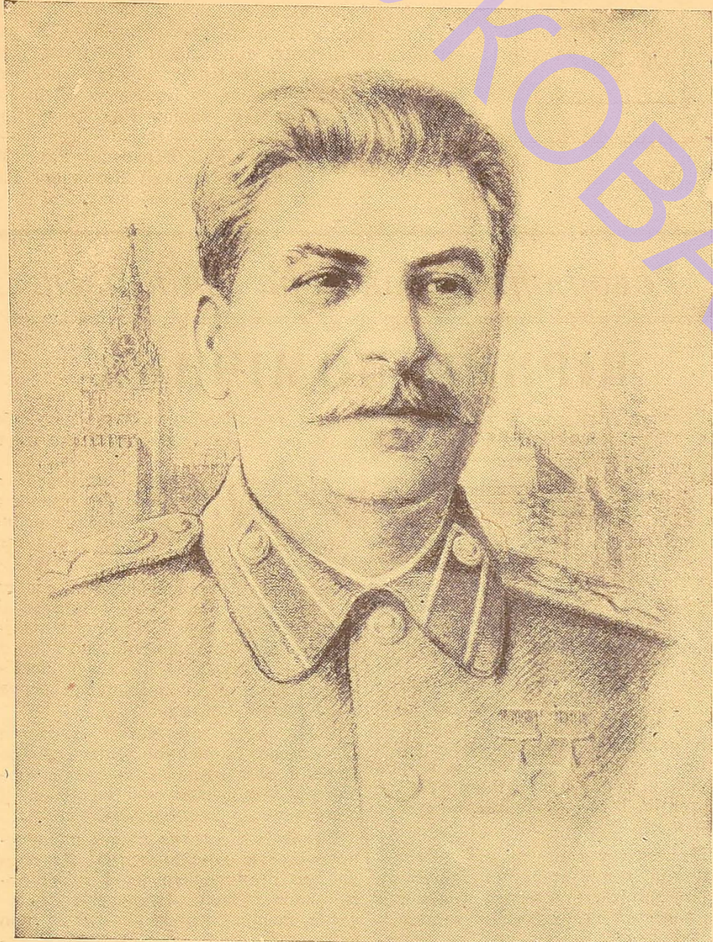
Велика історична місія випала на долю російського пролетаріату — першим прорвати ланцюг світового імперіалізму, визволити трудящих нашої країни від гніту капіталу, побудувати соціалістичне суспільство. До виконання цього історичного завдання робітничий клас нашої країни був підготовлений всією багатющою гігантською роботою Комуністичної партії. Організуючи бойовий союз робітничого класу і трудового селянства, партія забезпечила перемогу Великої Жовтневої соціалістичної революції, встановлення диктатури пролетаріату.

Ім'я Сталіна безмежно дороге радянським людям і трудящим всього світу. Все його життя було віддане великій справі визволення робітничого класу і всіх трудящих від гніту експлуататорів, справі боротьби за торжество комунізму. В жорсткій боротьбі з царизмом і капіталізмом понадихали великі ідеї марксизму-ленінізму, які вказували робітничому класові шляхи до визволення від експлуатації, до завоювання влади і побудови соціалізму. І. В. Сталін глибоко вірив в народ, в невичерпну революційну енергію і творчу ініціативу робітників та селян і в усій своїй діяльності спирався на маси, бачив в них справжніх творців історії. І. В. Сталін завжди виступав як вірний і достойний учень В. І. Леніна. У всьому і всюди він залишався вивченим ленінцем, стійким послідовником і захисником ленінських ідей. В Леніні він бачив великого творця і вождя нашої партії, керівника вищого типу, гірського орла, який не знає страху в боротьбі. Разом з В. І. Леніним і під його керівництвом І. В. Сталін боровся за партію нового типу, гартував її в непримиренній боротьбі з усіма ворогами ленінізму.