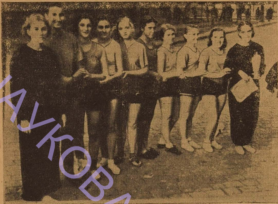
Активну громадську роботу—участь в спортивній роботі сполучають студентки фізико-математичного факультету з успішним навчанням. На фото: жіноча спортивна команда фізмату, що завоювала приз газети «За наукові кадри».