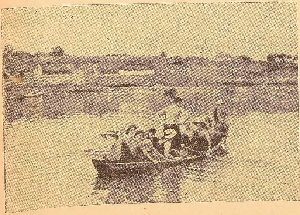
Весело і культурно провела літній відпочинок студентська молодь водної станції університету. Фото: група студентів на човні.

Група працівників обласного інституту удосконалення кваліфікації вчителів.