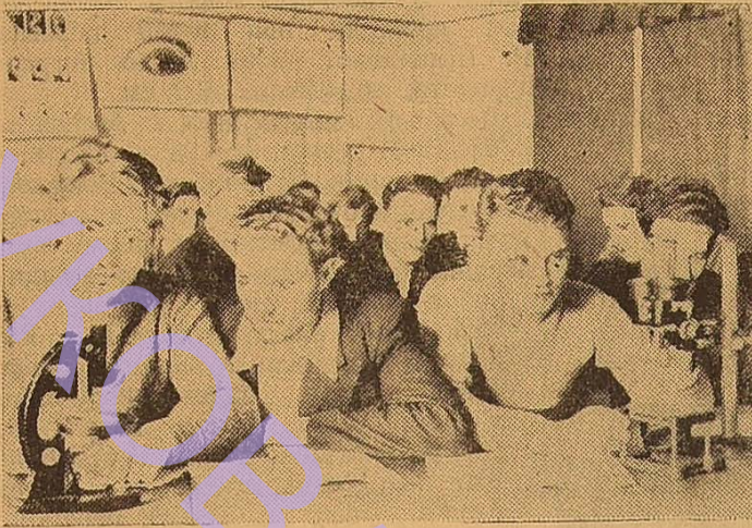
Практичні заняття в кабінеті криміналістики