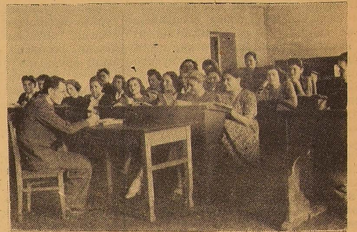
На семінарі з цивільного процесу.