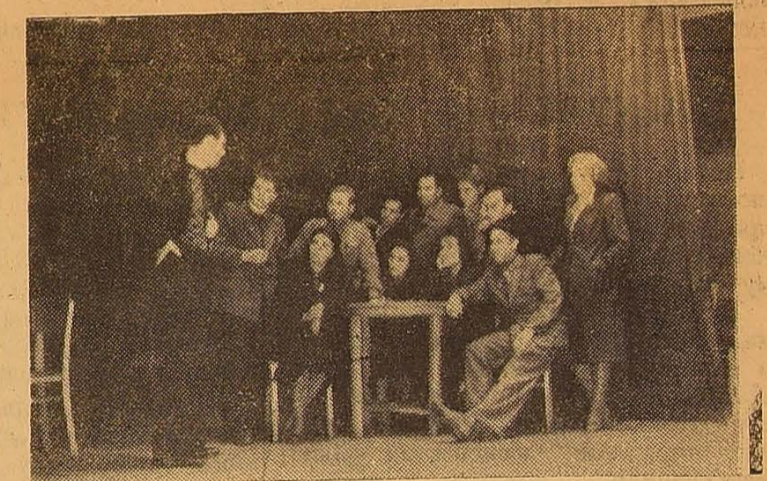
Репетиція російського драмгуртка.

Мітинг закінчився. Студенти і викладачі ставлять свої підписи під Зверненням Всесвітньої Ради Миру.