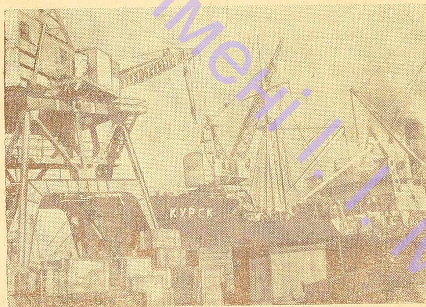
Відбудований Одеський порт.