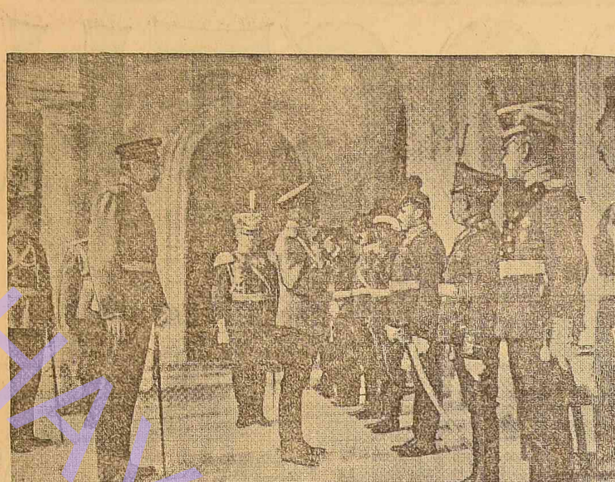
Представление Государю Императору авиаторов авиационной светотелеграфной школы.

Потому, что каждый день борьбы стоит итальянцам громадных денег.