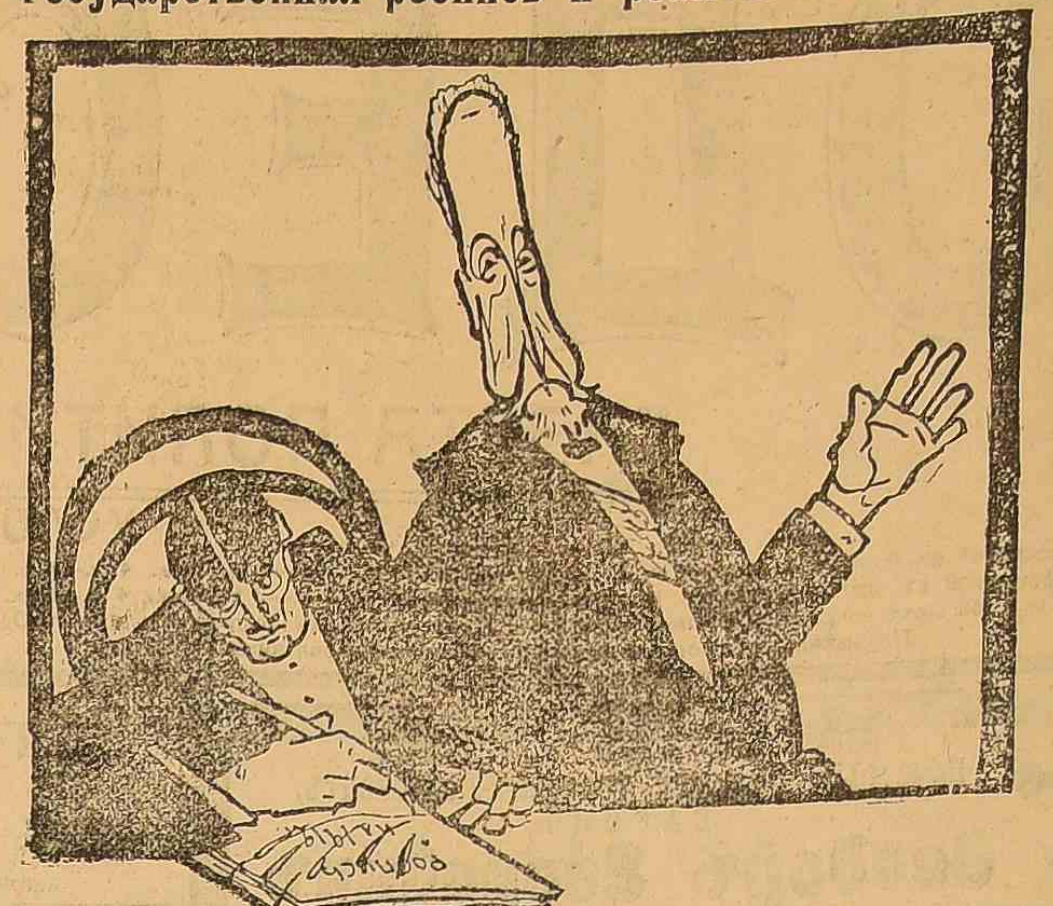
— Вы приняли миллиончиков 14—15 тысяч, чтобы их можно было легко списать, надо дать реально поработать и Государственной Думе.