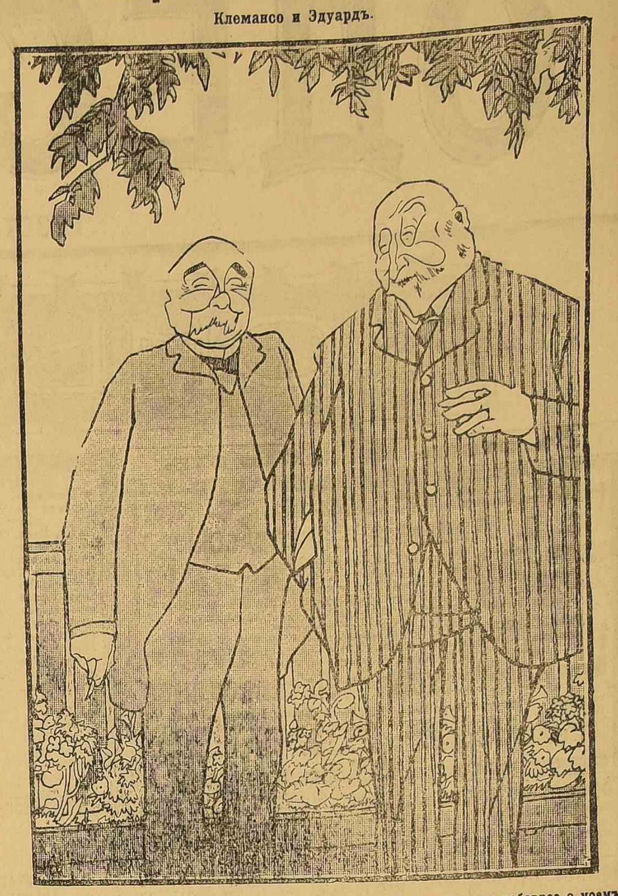
Итак, г. Клемансо, вы хотите, чтобы я расказывал вам еще кое что забавное о моем последнем свидании с цесаревичем в Кроберге...