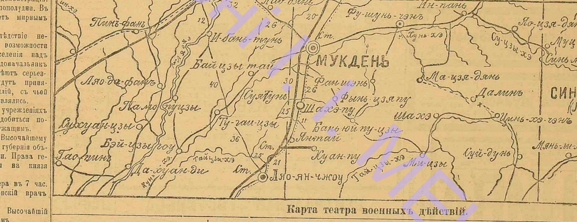
Карта театра военныхъ дѣйствій.

С. Пет. Телегр. Аг. Москва. Въ городѣ большое волненіе отъ ожиданій 19 февраля демократическаго Мокска. 19 февр. 2 часа полудня. Въ городѣ спокойно. Жизнь течетъ мирнымъ порядкомъ.