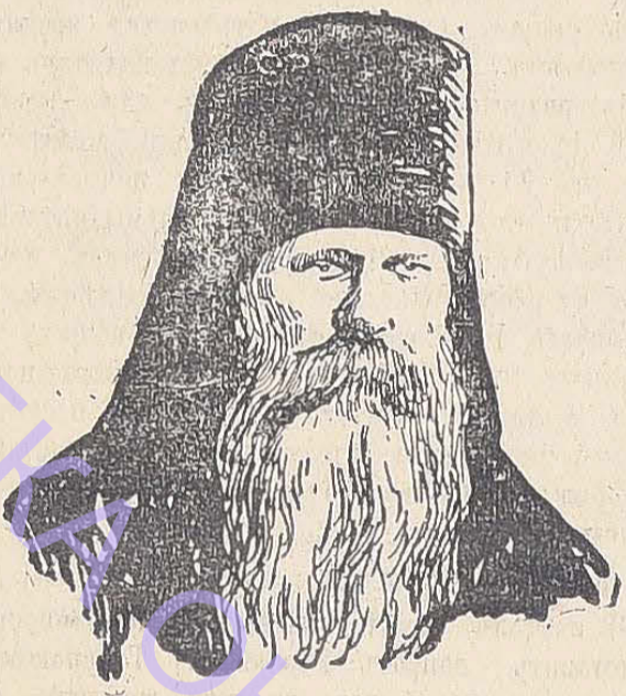
Членъ Госуд. Думы епископъ енисейскій и красноярскій Никонъ . (Къ его возврату въ Гос. Думу послѣ 2-лѣтняго отсутствія).

Согласно ст. 1081 т. X ч. I св. зак. гражд. госпитальное завѣщаніе имѣетъ силу домашняго духовнаго завѣщанія, имъ можно распоряжаться всякимъ имуществомъ, движимымъ и недвижимымъ, за исключеніемъ родового