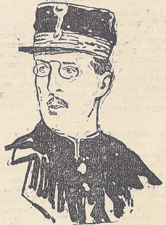
Король бельгийцевъ Альбертъ I. Последний портретъ короля-героя, сдѣланный англійскимъ художникомъ г. Спидомъ (Speed) на полѣ битвы.

ровъ продолжается мншная борьба, поддерживаемая временами артиллерійскимъ огнемъ. Пѣхотныхъ атакъ не предпринимается. Британскіе аэропланы сбивли германскій аппаратъ съ востоку отъ Даллесебе.