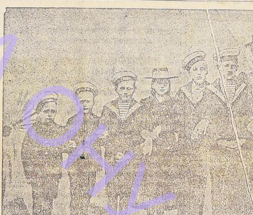
Въ войнѣ почившій великій князь Константинъ Константиновичъ и его супруги.

Въ Бразиліи состоялось чрезвычайное собраніе въ единственномъ дѣланіи въ началѣ 1915 года, въ которомъ участвовали представители бразильскаго правительства.