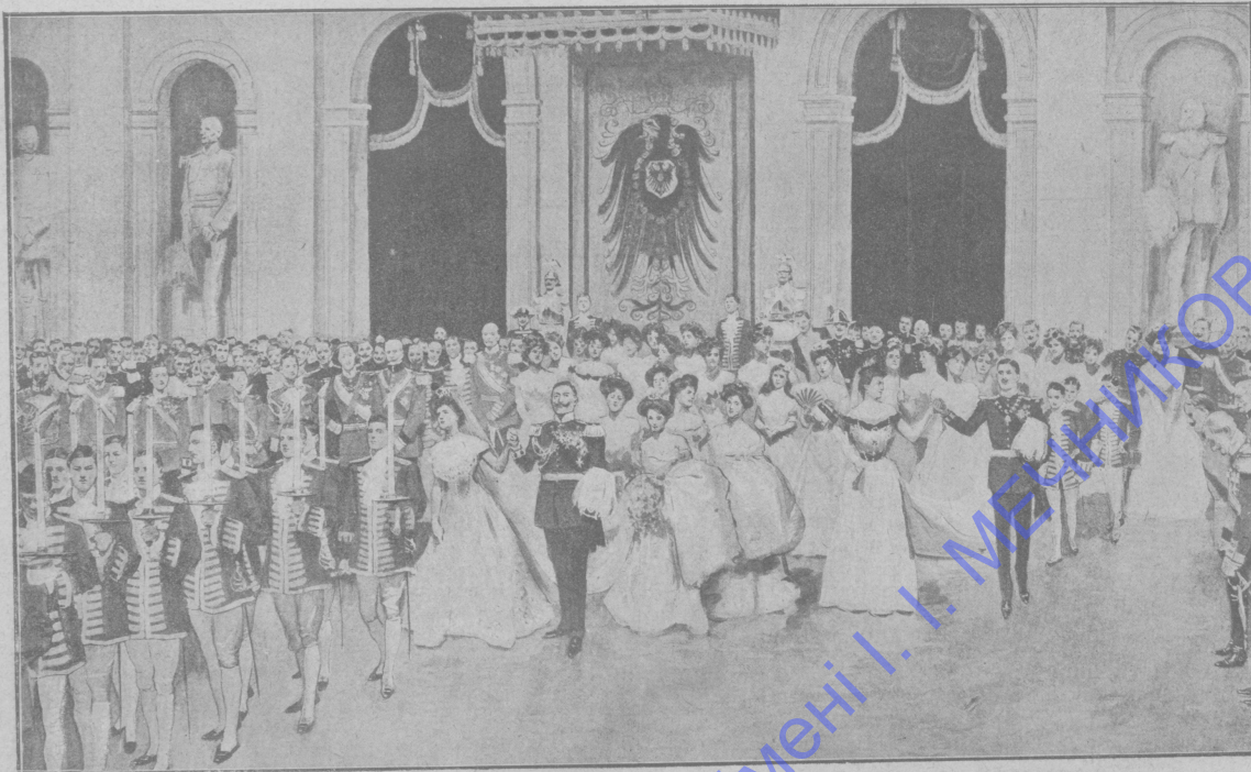
Берлинскія торжества по случаю бракосочетанія принца Этель-Фридриха. — Танецъ фанеловъ съ императоромъ и новобрачною во главѣ.