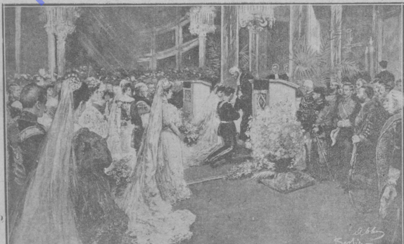
Вѣнчаніе принца Этель-Фридриха съ принцессой Софией Ольденбургской въ дворцовой церкви въ Берлинѣ.