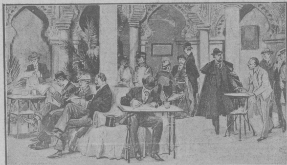
Въ Алхэсирасъ.—Делегаты вѣн конференціи.