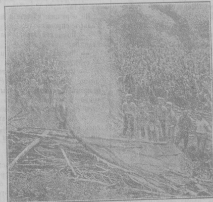
Соженіе труповъ послѣ сраженія

На слѣдующее утро, къ счастью, не было дождя, холодный вѣтеръ попрежнему дулъ,