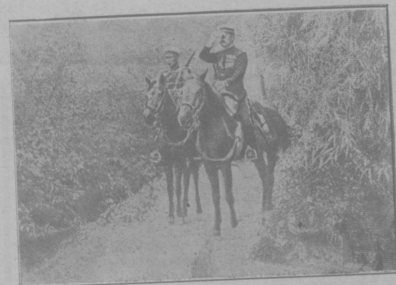
Японскіе офицеры на развѣдкѣ.

Представь себѣ, что первый разъ подъ пулями совсемъ не было страшно. Я прямо поражаюсь: отчего это? Должно быть, потому, что нервы до того были возбуждены, что какъ-то совершенно не думаешь о смерти. Пули кругомъ визжали страшно, хлопались о камни, падали люди, раненые и убитые. Точно ничего не замѣчаешь, что дѣлается