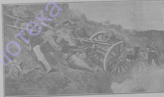
На позиціяхъ у Портъ-Артура. (Японцы втаскиваютъ орудія на горы).

Итакъ, я остановился понашему приходѣ въ Сандіаза. Изъ сотни, которая была въ авангардѣ, прискакалъ казакъ и объявилъ вамъ, что японцы въ сопкахъ, въ 1 1 / 2 верстахъ, и встрѣтили нашихъ страшными