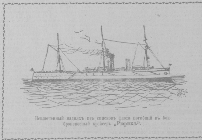
Исключенный надвѣхъ изъ списковъ флота погибшій въ бою броненосный крейсеръ «Рюрикъ».

навливались передъ слѣбыми; дѣвочка бросала монету въ корзиночку и ласкала чумазую, грязную собаку, которая вытягла хвостомъ въ знакъ благодарности.