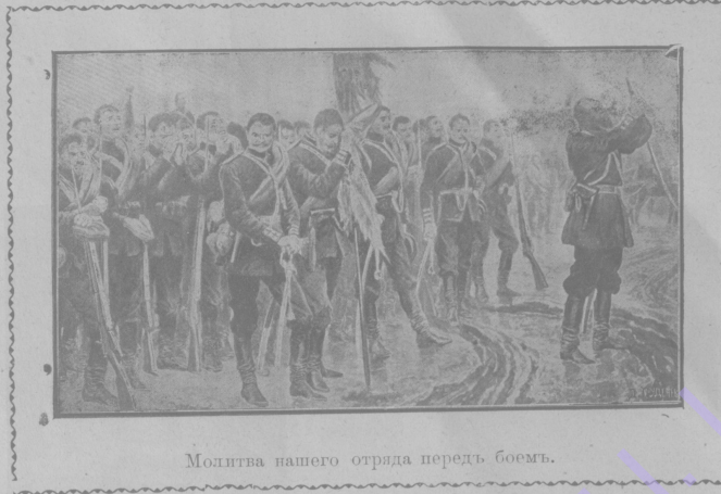
Молитва нашего отряда передъ боемъ.

Палаццо, около котораго вѣтиса старикъ, былъ, какъ мы ужъ говорили, одной изъ самыхъ роскошныхъ достроекъ во всемъ городѣ. Черезъ ворота видѣлся дворъ, украшенный высокими колоннами, а за нимъ тѣнистый садъ съ старинными деревьями и чудными фонтаномъ. Каждое утро, когда погода не была очень плоха, изъ этихъ воротъ выходила свѣтлорусая дѣвочка, красивая какъ фея, она держала за шелковый шнурочекъ своего любимца, толстаго ворчливаго мопса. Губернантка нѣмка шла за ними вслѣдъ. Каждый день всѣ трое оста-