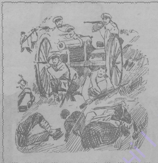
На артиллерійской позиціи во время боя.

Командовалъ подъ Ляономъ въ августовскихъ бояхъ бывшимъ отрядомъ графа Келлера и довелъ до высокаго совершенства огонь нашей артиллеріи.