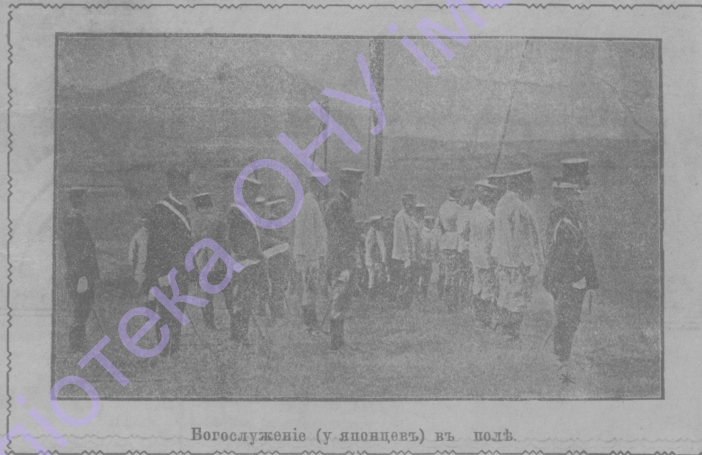
Вогослуженіе (у японцевъ) въ полѣ.