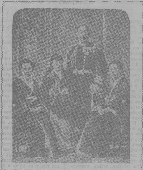
Адмиралъ Камимуръ и его семья.