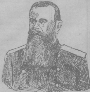
Состоящий в распоряжении командующего манчжурскою армией, ген.-лейт.