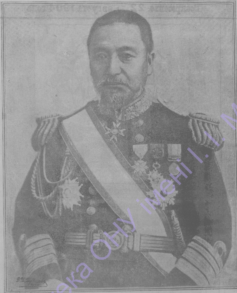
Адмиралъ Т О Г О .

стали стесняться съ уваженіемъ. Самъ онъ не зналъ, что попалъ въ благородную компанію, для него всё эти люди были просто товарищами. Когда онъ узналъ, что все это избранники, онъ предпочиталъ садиться къ столу болѣе скромныхъ людей. У столовъ парилъ тонъ, который въ концѣ концовъ былъ ему неприятенъ. Всѣ они изрекали какъ жрецы, Венделину стало какъ-то жутко, онъ чувствовалъ себя все болѣе и болѣе чужимъ между ними. Но разъ онъ началъ лоскаться ихъ, то было неудобно отстать отъ нихъ, надо было, чтобы для этого представился случай; и вотъ этотъ случай представился совершенно неожиданно. Какъ то за кружкой пива Киперъ, фабрикантъ желѣза и чугуна, сказалъ: