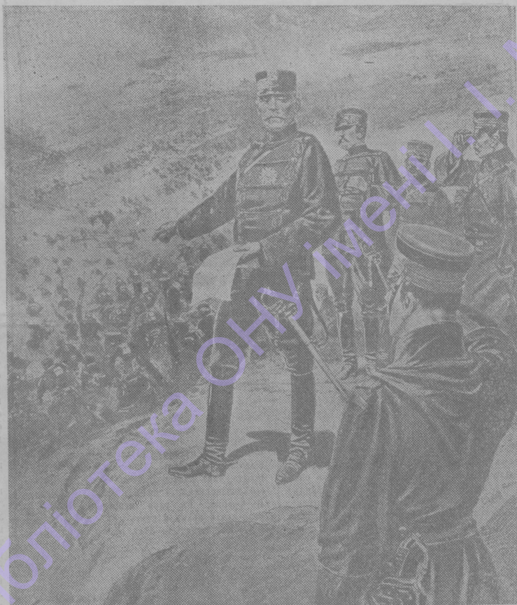
Генераль Куроки на позиціи во время штурма его арміей Кюленчена (при переходѣ черезъ р. Ялу).