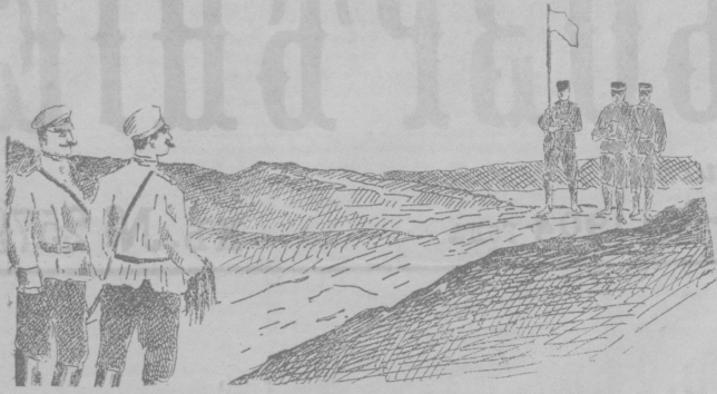
Прибытие японского парламентария капитана Ямаока с предложением о сдаче Порт-Артура.