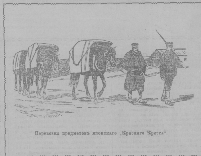
Перевозка предметовъ японскаго „Краснаго Креста“.

бечеть свою пѣсенку. Гордости у нея не было ни на волосъ! Она говорила такъ просто, такъ ласково, точно съ равнымъ себѣ человѣкомъ, а не съ дикимъ Францемъ! И Францъ, въ одно мгновенье, забывъ свой дикій нравъ и сталъ съ ней весело болтать и смѣяться. Лѣсъ въ то время шу-