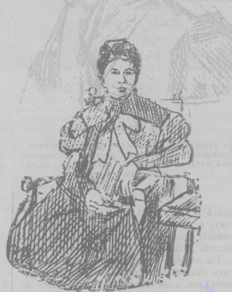
Мать А. П. — Евгения Яковлевна ЧЕХОВА. (Съ послѣдняго портрета).