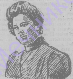
Сестра А. П. — Марія Павловна Чехова.