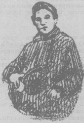
А. П. Чеховъ — по окончании гимназии.