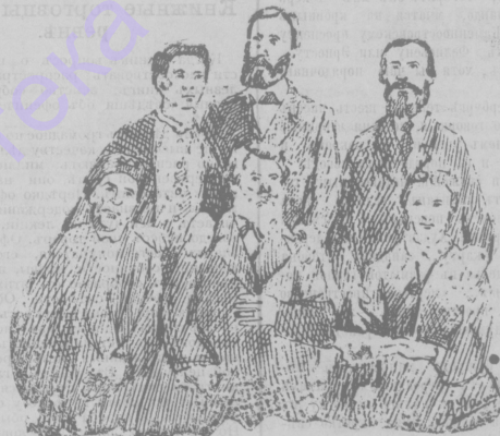
Семейная группа Чеховыхъ (1855 года).

И странно думать, что тамъ вправо за рѣкою уже японцы. Тамъ медленно и лѣвосторонне опасно наступаетъ на насъ армія Куроки. И опять ярко встаетъ передо мною сцена падающихъ людей, слышатся шуршанье и какой то нервный поплотъ подлетающей ирантели, металлическій звонъ разрыва и жалобный свистъ пуль. Вижу разнесенъ на жесткой утолстой платформѣ, съ скатанной шнелею подъ голову, лежащихъ безъ всякой поддержки на спинѣ и съ укоромъ смотрящихъ на жаркое поудонное солнце, что печетъ такъ сильно, такъ невозможно... Вижу мертвыхъ. Блѣдыхъ, жем-