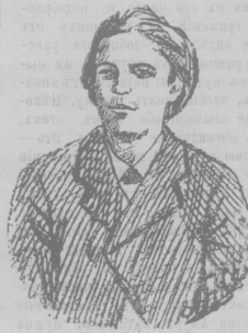
А. П. Чеховъ — студентъ.