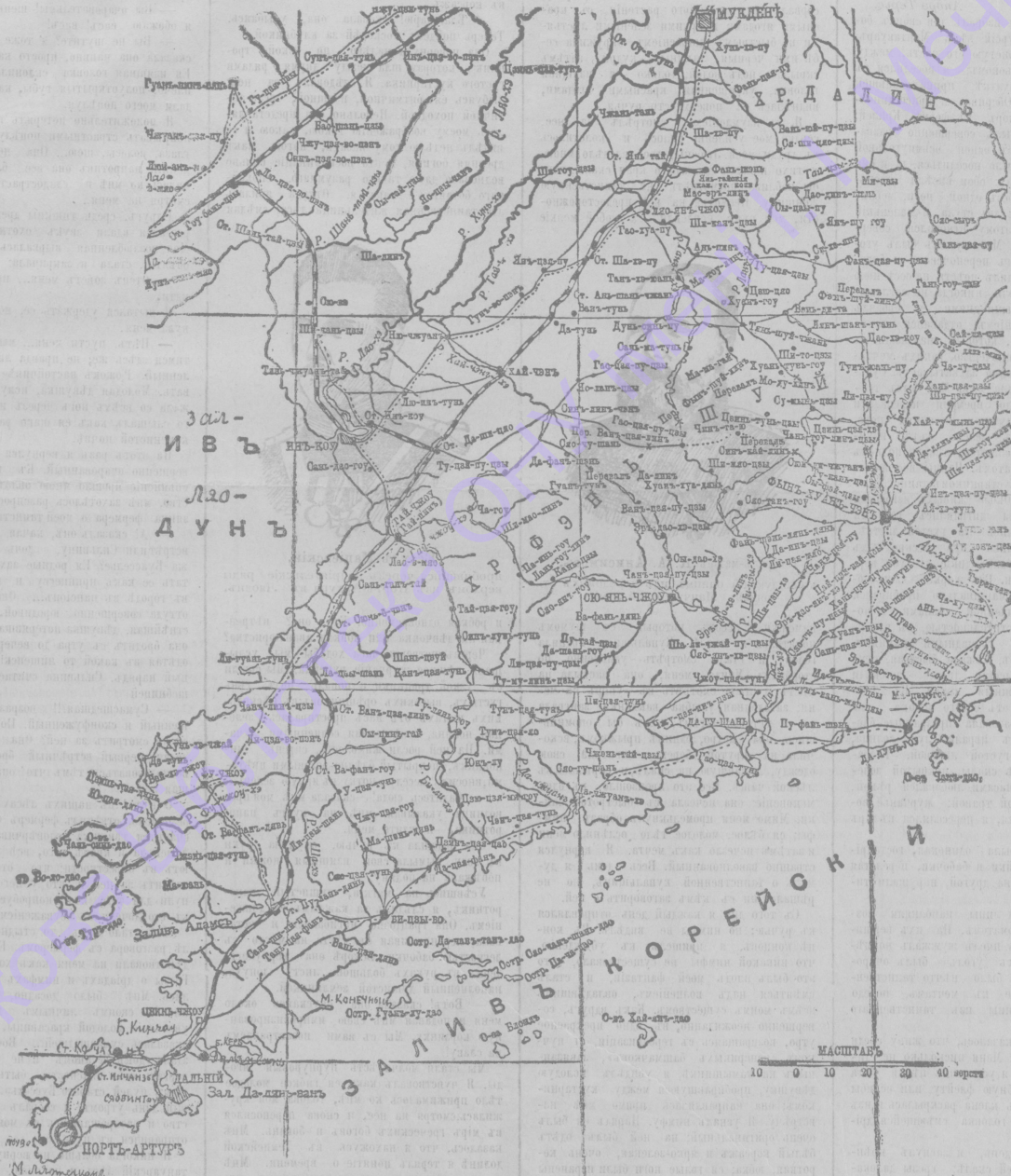
Карта театра военныхъ дѣйствій.