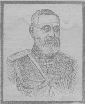
Ген.-адъют. П. С. ВАННОВСКИЙ (7 16 февраля, въ 12 часовъ ночи).