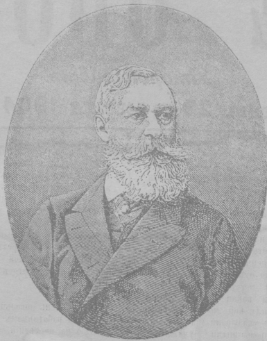
Извѣстный русскій ученый, проф. В. Н. ЧИЧЕРИНЪ, философъ, государствовѣдъ и историкъ права. † 4 февраля.

ственное попаданіе въ дѣла увѣряетъ увѣренность не только команды того судна, съ котораго былъ брошенъ снарядъ, но и всего флота. Приблизительно эти же соображенія побудили и нашихъ адмираловъ заставить порученныя имъ эскадры маневрировать такъ чтобы онѣ могли обстрѣлывать другъ друга на далекихъ дистанціяхъ. Назовемъ одинъ флотъ флотомъ А, а другой В. Первый состоитъ, главнымъ образомъ, изъ судовъ, имѣющихъ значительныя незабронированныя поверхности, и адмиралъ замѣчаетъ скорѣе, что неприятельскій огонь приноситъ ему большій вредъ, нежели его суда, велятъ лучше забронированнымъ судамъ противниковъ. Парунами стѣны нѣкоторыхъ судовъ имѣютъ уже