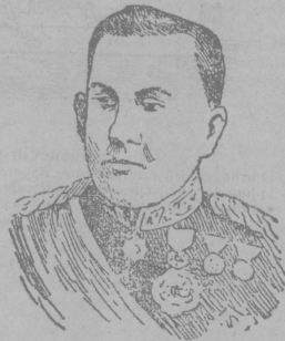
Маршалъ ОЙМА, начальникъ японскаго главнаго штаба.

Надъимъ доносился грохотъ ракетъ и фейерверковъ, звуки музыки, аккомпаниро-