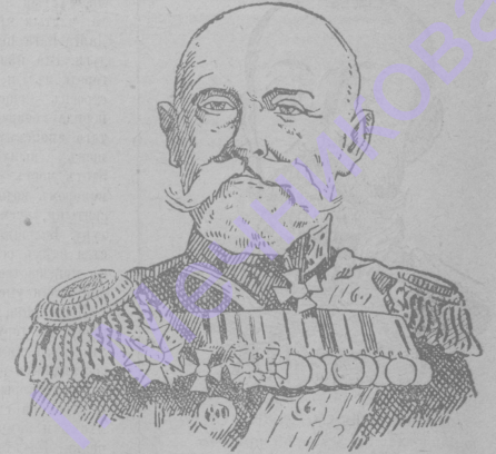
ГЕНЕРАЛЬ-ЛЕЙТЕНАНТЪ Н. П. ЛИНОВИЧЪ Командующий войсками Приамурскаго края.