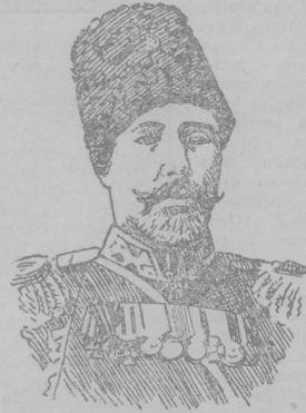
Генераль-лейтенантъ А. М. Стессель Командиръ 3-го Сибирскаго корпуса.