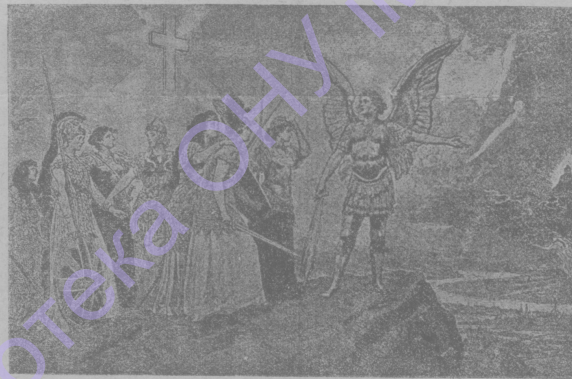
«Народы [Европы! Защищайте свое достояніе!»

Японія подвигается впередъ гигантскими шагами и народъ уже теперь начинаетъ принимать участіе въ управленіи страной. Стремленіе къ самоуправленію стало развиваться въ Японіи, начиная уже съ 1859 года, какъ только страна была открыта для иностранцевъ и японцы получили возможность ближе ознакомиться съ европейскими обычаями. Никако помешать насстрѣчу желаніямъ общества и ежедневно создававшимся въ Токио губернаторовъ провинцій, для еовмѣстнаго обсужденія нуждъ и желаній народа. Между тѣмъ, въ народѣ стали образовываться небольшія политическія ассоціаціи, имѣвшія цѣлью вызвать движеніе къ повсюду конституціоннаго управленія и