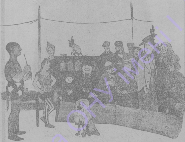
— Теперь, господа, мой пудель опредѣлитъ возрастъ одной изъ присутствующихъ дамъ! Будьте спокойны, милостивая государыня, онъ умѣетъ считать только до 25.

жидая — скулы, несколько приплюснутый нос, маленькія уши, густыя брови, красиво очерченный ротъ, съ тонкими губами, и вышнихъ классовъ населения, и большой ротъ съ толстыми губами у низшихъ классовъ, руки и ноги маленькія, красивой формы. Женщины въ Кореѣ занимаютъ очень низкое общественное положение и въ строгихъ народныхъ нравахъ и воззрѣній, и въ глазахъ закона. Онъ не несетъ личной отвѣтственности за свои поступки и всю жизнь пребываетъ подъ опекой мужчинъ. Въ то же время имъ предоставлена значительная свобода въ ихъ домашней жизни; только въ высшихъ классахъ общества женщины живутъ въ затворничествѣ. Мужчины вступаютъ въ бракъ, въ возрастѣ отъ 18 до 20 лѣтъ, женщины обыкновенно въ 16 лѣтъ. Полигамія запрещена, но кокетничать считается всею дозволеннымъ. Среди высшей знати вторичный бракъ явномъ есть вѣщо до того предосудительное, что дѣти отъ такого брака не признаются законными; напротивъ того, среди простого народа вторичный бракъ одинаково допускается для обоихъ половъ. Сильная любовь къ дѣтямъ есть одна изъ лучшихъ национальныхъ добродѣтелей корейцевъ; о подкидышахъ и дѣтубойствахъ—явленіяхъ столь распространенныхъ въ Китаѣ—здѣсь почти не приходится слышать.