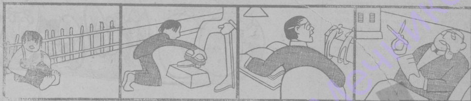
Много свободнаго времени—мало денегъ.