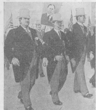
Агитация въ пользу Тафта на улицахъ въ Чикаго.

Приверженцы вышедшаго президента Соединенныхъ Штатовъ, выставившаго свою кандидатуру отъ республиканской партіи на постъ новаго президента, на дняхъ устроили большую агитационную прогулку по улицамъ Чикаго съ портретомъ кандидата. Публика рано приняла эту демонстрацію: сторонники Тафта одобрительными возгласами приветствовали шестая, приверженцы Рузвельта и другихъ кандидатовъ свистали имъ въслѣдъ.