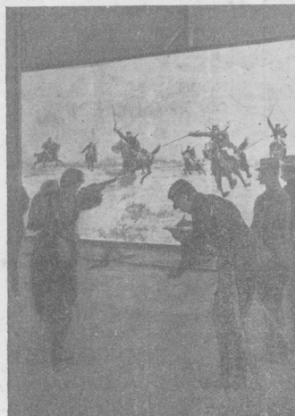
Стрѣльба по картинамъ синемаатографа. Во Франціи въ войскахъ происходитъ обученіе стрѣльбѣ по картинамъ синемаатографа. На экранѣ изображены движущіеся неприятель и солдатъ, долженъ попасть во всѣхъ движущихся картинахъ въ намѣченный неприятеля.

Въ англійскомъ историческомъ городѣ High Wycombe существуетъ своеобразный обычай: немедленно послѣ избранія городского головы, звѣшивать его на висѣлахъ. По истеченіи срока, въ который онъ былъ избранъ, его снова звѣшиваютъ. Такимъ образомъ, констатируется фактъ работы лордъ-мера на пользу города. Потерявшие въ висѣхъ могли рассчитывать быть вновь избранными на эту должность, т. е. дѣятельность на пользу города засвидѣтельствовалась всѣми. Обычай этотъ существуетъ и понынѣ.