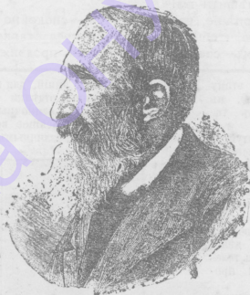
Иосифъ Игн. Крашевскій.

Къ 100-лѣтію рожденія. (Родился 28-го іюня 1812 г. въ Варшавѣ).