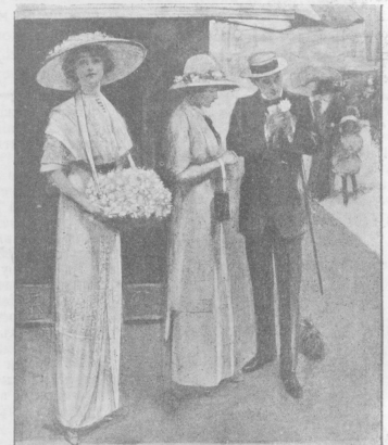
Дочь лондонскаго лордъ-мера, продающія дикія розы въ „день Александра“ въ Лондонѣ были устроены съ благотворительною цѣлью. 10.000 дамъ и дѣвцъ вышли на улицы и продавали искусственныя цвѣты дикой розы.

Къ 100-лѣтію рожденія. (Родился 28-го іюня 1812 г. въ Варшавѣ).