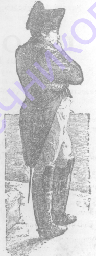
Наполеонъ на о. св. Елены.