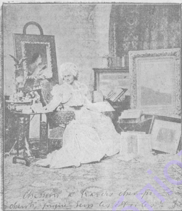
Королева Елизавета румынская (Кармень Сильева) въ своемъ рабочемъ кабинетѣ. Королева въ настоящее время тяжко занемогла.