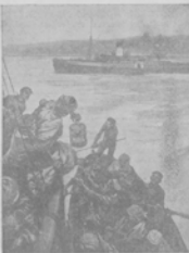
Помощникъ на спасательномъ плоту, спущенномъ изъ парохода „Осеада“ послѣ столкновения съ пар. „Ривадия“.

Помощникъ въ моментъ столкновения „Осеада“ послѣ того, какъ пароходъ, не успѣвъ вырваться, столкнулся съ „Ривадия“.