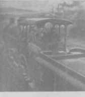
Пароходъ, несомый угольную забавочную субсидію въ одну изъ комнатъ банна Родригеса.