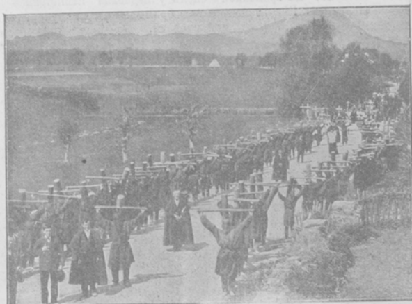
Процессія кающихся въ Испаніи въ Страстную Пятницу. Такія процессіи „кающихся“, съ тяжелыми крестами, до нынѣ происходятъ на границахъ Испаніи и Франціи. Нашъ рисунокъ рельефно изображаетъ этотъ пережитокъ средневѣковой старины.