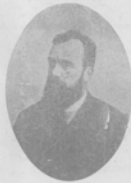
Глбъ Успенскій. (Изъ воспоминаній современн.)