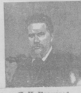
М. Н. Крамскій. (Съ портрета, писаннаго М. Е. Рабиновичемъ въ 20 лѣтъ отъ дня смерти).