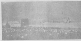
Надано опера „Анда“ была поставлена на открытомъ воздухѣ, на временной сценѣ у подножія Египетскихъ пирамидъ. Рѣдкій спектакль собралъ много международнои публики.