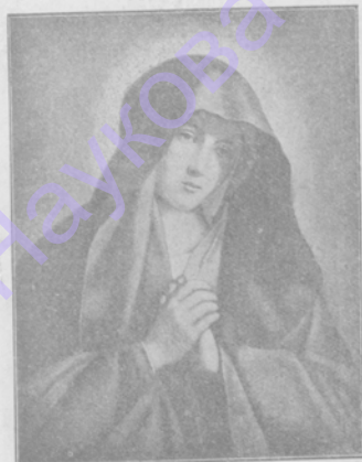
Богоматерь. Карт. А. Сасюферто.