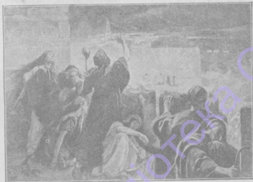
Свершилось! Карт. Р. Ванъ-Удера.