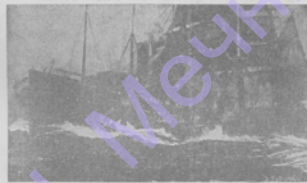
Столкновение между пароходами „Осеада“ (Г. в. в.) и „Ривадия“ (4-хъ вѣстовыхъ судовъ „Ривадия“ у Восточнаго Мыса) Пароходъ въ результатѣ этого столкновения погибъ, при чемъ бѣжалъ и человекъ изъ экипажа.

Пароходъ, возвращавшійся изъ Одессы, попалъ въ бурю и, не успѣвъ вырваться, столкнулся съ „Ривадия“.