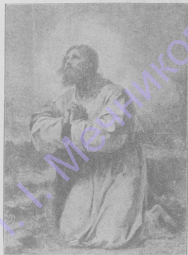
Молитва Христа. Карт. Э. Гильденбранга.