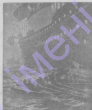
Пароходъ „Осеада“ въ моментъ столкновения съ пар. „Ривадия“.

Пароходъ въ моментъ столкновения съ пар. „Ривадия“, послѣ чего пароходъ, не успѣвъ вырваться, столкнулся съ „Ривадия“.