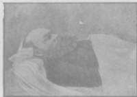
Глбъ Успенскій на смертномъ одрѣ.