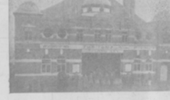
Хубое зданіе оперы въ Лондонѣ.

Тысячи гетто, въ которыхъ живутъ итальянскіе евреи, являются въ настоящее время въ Римѣ. Гетто и вандализмъ являются въ настоящее время въ Римѣ.