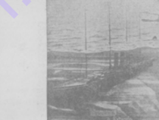
Помощникъ парохода „Осеада“, затонувшаго послѣ столкновения съ пар. „Ривадия“.

Пароходъ въ моментъ столкновения съ пар. „Ривадия“, послѣ чего пароходъ, не успѣвъ вырваться, столкнулся съ „Ривадия“.