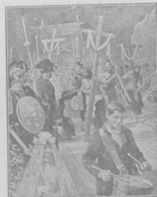
Изображеніе страстей Господнихъ у озера Лекко въ Италиі.