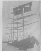
Четырехмачтовый пароходъ „Ривадия“ послѣ столкновения.