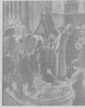
„Современные гетты и вандализмъ въ Римѣ“.

1) Типичный германскій угольный гусякъ, 2) Типичный германскій угольный гусякъ, разбѣгающійся по улицѣ, 3) Типичный германскій гусякъ.