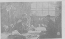
Видна забавочной субсидіи въ одной изъ комнатъ банна Родригеса.