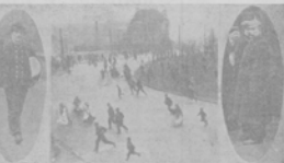
Хъ забавѣ въ Термакѣ.

Помощникъ на спасательномъ плоту, спущенномъ изъ парохода „Осеада“ послѣ того, какъ пароходъ, не успѣвъ вырваться, столкнулся съ „Ривадия“.