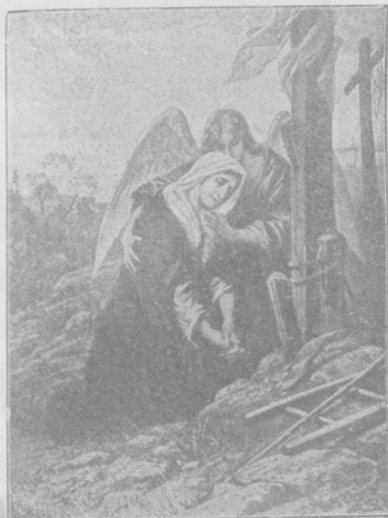
Богоматерь у креста. Карт. Ноккерста.