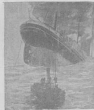
Гибель парохода „Осеада“.

Пароходъ, возвращавшійся изъ Одессы, попалъ въ бурю и, не успѣвъ вырваться, столкнулся съ „Ривадия“.