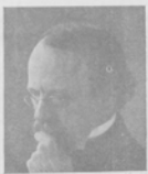
Проф. ТОМСОНЪ, знаменитый англійскій физикъ, получившій отъ короля Георга орденъ „Заслуга“.

Ангельская палата общинъ. Вѣдущій членъ палаты общинъ, англійскій дипломатъ, лордъ Фишеръ, въ настоящее время находится въ Петербургѣ.