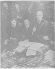
Въ англійской палатѣ общинъ.