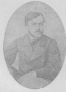
Глбъ Успенскій въ молодости.