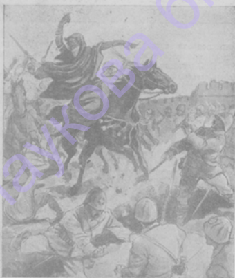
Грабительница амазонка въ битвѣ противъ италійцевъ. Видѣ- дуются ея войско для нападенія на враговъ. При взятіи италійцами оазиса Гаргарешъ нѣкогда сѣлающей эпизодъ. Италійцы брали приступомъ чуть-ли не каждую пядь земли и, хотя и медленно, но подвигались впередъ. Наконецъ, оставалось лишь небольшое углубленіе, въ которомъ засѣла гучка отважныхъ храбрецовъ и отчаянно сражалась. Сила была неравная и огонь неприятеля все удушилъ и рѣшилъ, и совершенно прекратился. Ободренные успѣхомъ итальянцы двинулись на приступъ. Какъ наругу изъ укрѣпленія на нихъ выпулилъ торсъ арабъ, во главѣ котораго висѣла на лошади страшная фигура. Испуганные столь необычайнымъ предводителемъ, солдаты бросились въ бѣгъ. Наводя на скружающую страхъ черную амазонку со своимъ отрядомъ благополучно пробралась черезъ ряды италійцевъ и присоединилась къ отступающему отряду.