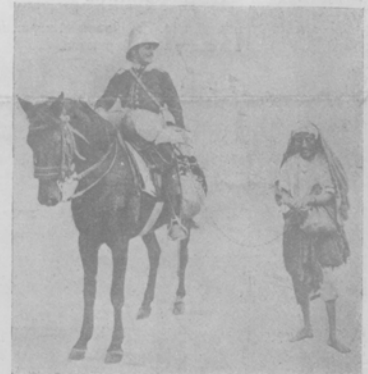
Горе побѣжденнымъ, Италійскій кавалеристъ ведетъ на цѣпи плѣннаго араба.