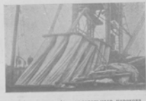
Портрет артиста оперы...