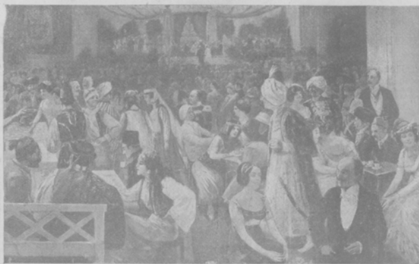
«Восточное» празднество, устроенное берлинскимъ отдѣленіемъ германскаго колониальнаго общества въ Зоологическомъ саду.

Идея этого праздника принадлежала художнику Курту Гавелькампу и носитъ названіе «Путешествіе въ таинственный храмъ Тачималъ въ Индїи». 500 персона въ великолѣпныхъ костюмахъ танцовали передъ золотымъ изображеніемъ Будды. Путешествіе совершено было черезъ Венгрію въ Южную Россію, на Кавказъ, въ Аравію и Англію. Каждая страна и народность были показаны танцами и обстановкой. Участниками праздника были учащіеся академіи художествъ, члены спортивныхъ клубовъ, пѣвчскія капеллы, дамы и мужчины изъ нашего берлинскаго общества.