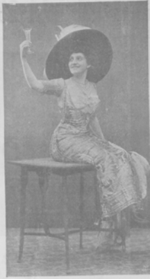
И. И. ТАМАРА, артистка оперетты и комической оперы.