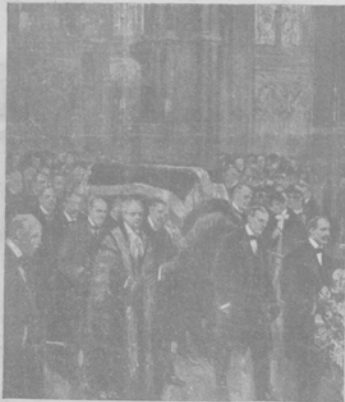
Панихида по скончавшемся на-дняхъ знаменитомъ англійскомъ врачѣ лордѣ Листерѣ въ Вестминстерскомъ аббатствѣ.