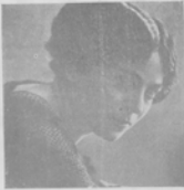
Ина Кремер, артистка русской оперы.