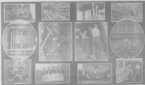
Снимки из жизни и деятельности артистического коллектива...