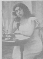
Е. В. Сантано, артистка русской оперы.