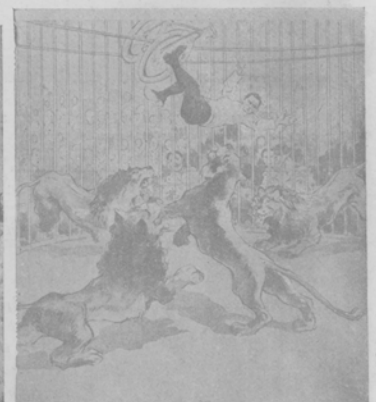
Паденіе велосипедиста въ клітку со львами въ за- ринцѣ въ Ала-с.-нѣ.

Идея этого праздника принадлежала художнику Курту Гавелькампу и носитъ названіе «Путешествіе въ таинственный храмъ Тачималъ въ Индїи». 500 персона въ великолѣпныхъ костюмахъ танцовали передъ золотымъ изображеніемъ Будды. Путешествіе совершено было черезъ Венгрію въ Южную Россію, на Кавказъ, въ Аравію и Англію. Каждая страна и народность были показаны танцами и обстановкой. Участниками праздника были учащіеся академіи художествъ, члены спортивныхъ клубовъ, пѣвчскія капеллы, дамы и мужчины изъ нашего берлинскаго общества.