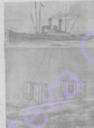
Портрет артиста оперы...