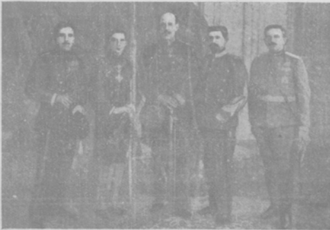
Александръ Божидъ Константинъ Фердинандъ Данило (сербскій), (болгарскій), (греческій), (румынскій), (черногорскій).

Наслѣдники престоловъ Балканскихъ государствъ.