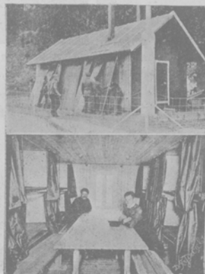
1) Зимняя квартира Амундсена на краю великаго леянаго барьера. 2) Внутренній видъ этой зимней квартиры, названной "Framheim".