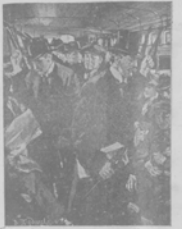
Трехднейныя занятія во время выборовъ въ Думу.