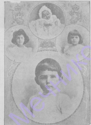
Іоланда Джованна Мегралада. Тумберто. Дѣти итальянскаго короля.

Жители гор. Астрахани возбуждаютъ передъ высшею духовною властію ходатайство о причисленіи къ лику святыхъ астраханскаго и терскаго митрополита Іосифа, злодѣйски замученнаго и убитаго во второй половинѣ XVII вѣка. Соотвѣствующее прошеніе объ этой новой канонизаціи затѣвательно было и получило масовую подписку еще въ концѣ январскаго (1911) года. Жизнь и дѣятельность астраханскаго святителя-мученика относится къ кровавой, громкой и ужасной эпохѣ Стеньки Разина. Поборникъ благочестія и высокихъ аскетическихъ подвиговъ, митрополитъ Іосифъ былъ и однимъ изъ мужественныхъ ратоборцевъ земли родной, въ тогдашніе тяжелые и нелегкіе годы. Церковно-общественныя заслуги его, въ особенности для астраханскаго края, велики.