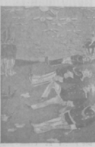
Въ Германи. Центръ водонепроницаемаго факта.