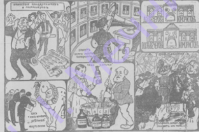
Рис. С. Гольдман. Тень Зависимости. Кинотеатры, рестораны... (Кладовые справляют зимы?)