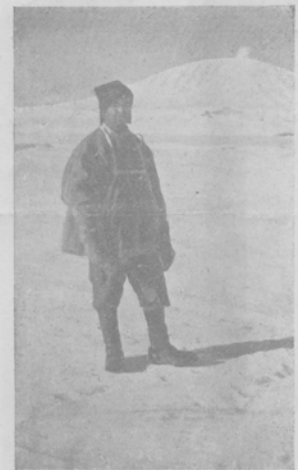
Англискій капитанъ Скоттъ, начальникъ ольшой антарктической экспедиціи и соперникъ Амундсена, въ своемъ полярномъ одѣяніи.

Когда въ 1909 г. англичанинъ Шеклтонъ достигъ 83 град. и 23 мин. южной широты или, иначе говоря, когда осталось пройти до южнаго полюса всего 111 километровъ - اسک заявилъ утверждать, что, наконецъ-то, южный полюсъ будетъ открытъ. И действительно, туда вскорѣ направились сразу пять экспедицій. Первыми достигъ полюса норвежцы Амундсенъ. Въ настоящее время къ полюсу приближаются англичанинъ Скоттъ.