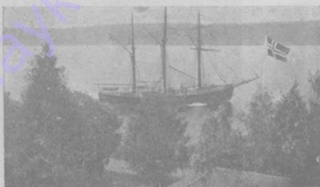
Корабль "Фрамъ", на которомъ сплывала экспедиція Амундсена. На томъ-же кораблѣ совершалъ экспедицію къ Северному полюсу Нансенъ въ 1897 году.

Когда въ 1909 г. англичанинъ Шеклтонъ достигъ 83 град. и 23 мин. южной широты или, иначе говоря, когда осталось пройти до южнаго полюса всего 111 километровъ - اسک заявилъ утверждать, что, наконецъ-то, южный полюсъ будетъ открытъ. И действительно, туда вскорѣ направились сразу пять экспедицій. Первыми достигъ полюса норвежцы Амундсенъ. Въ настоящее время къ полюсу приближаются англичанинъ Скоттъ.