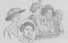
Сuffражистки и ихъ знаменитыя перья сузья, привлеченныя въ послѣднее время въ Одессу.