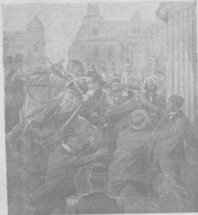
Покушеніе на жизнь итальянскаго короля Виктора Эмануила.