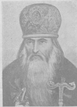
Святитель Іосифъ, митрополитъ Астраханскій. Къ канонизаціи митрополита.

Жители гор. Астрахани возбуждаютъ передъ высшею духовною властію ходатайство о причисленіи къ лику святыхъ астраханскаго и терскаго митрополита Іосифа, злодѣйски замученнаго и убитаго во второй половинѣ XVII вѣка. Соотвѣствующее прошеніе объ этой новой канонизаціи затѣвательно было и получило масовую подписку еще въ концѣ январскаго (1911) года. Жизнь и дѣятельность астраханскаго святителя-мученика относится къ кровавой, громкой и ужасной эпохѣ Стеньки Разина. Поборникъ благочестія и высокихъ аскетическихъ подвиговъ, митрополитъ Іосифъ былъ и однимъ изъ мужественныхъ ратоборцевъ земли родной, въ тогдашніе тяжелые и нелегкіе годы. Церковно-общественныя заслуги его, въ особенности для астраханскаго края, велики.