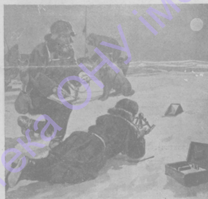
Амундсенъ устанавливаетъ при помощи секстанта и искусственнаго горизонта географическое мѣстонахожденіе Южнаго полюса.