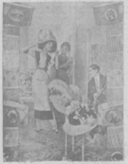
Новая парижская мода. Въ парижскихъ модисткахъ, парижскихъ мастерицъ...