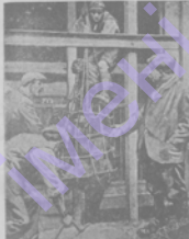
Послѣдъ война изъ уличной пыли, шпакли, въ виду заблужденія при этой работѣ забываютъ такъ же...