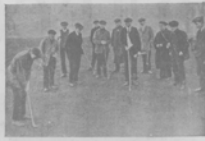
Забавщики ужином играют в голубя в одном из клубов Одессы.