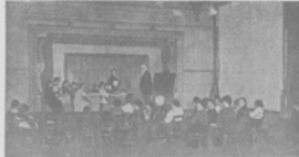
Дружный ужинъ, съуживъ помню во дни, когда въ кругу была утренняя школа...