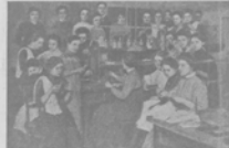
Практический зачетъ въ химической лабораторіи.