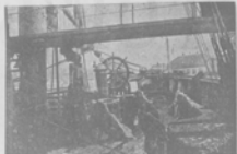
Судня Анжурская. В пятницу утром Анжурская, одна из крупнейших машин, выехала из дока судостроительного завода в Одессе...