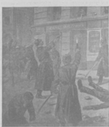
Специальные полиціи съ ружьями устроены, въ Одессѣ, для охраны порядка въ виду...