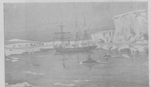
Судно экспедиціи Амундсена "Фрамъ" въ оухтѣ "Whalles'a" избранной главной базой экспедиціи.