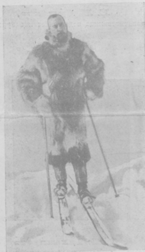
Капитанъ Роальдъ Амундсенъ открывшій южный полюсъ на норвежскихъ "ски".

3-го декабря 1911 г. норвежскимъ путешественникомъ Амундсенемъ, наконецъ достигнутъ Южный полюсъ. Вместе съ Амундсенемъ полярис достигли 5 человекъ. Путешественникамъ была принята система приближенія къ полюсу постепенными этапамъ. Последняя ступень была устроена на разстояніи мѣсяца пути отъ полюса. Этотъ мѣсяцъ путешественникамъ пришлось двигаться по странной таежной дорогѣ, среди недвижныхъ глыбъ и скалъ по мѣстности, названной ими "Вальмиръ, замокъ дьявола". Наконецъ, 2-го декабря они, сбавивъ вычисленныя, увидѣли, что находится подъ 89° 55' южной широты, т. е. въ непосредственномъ соседствѣ съ полюсомъ. Сбавивъ еще 9 километровъ на югъ, они на слѣдующій день воздвигли на снѣжной равнинѣ норвежскій флагъ. Затѣмъ экспедиція двинулась обратно и черезъ мѣсяцъ добралась до зимней стоянки, сохранивъ 11 собакъ. Теперь корабль "Фрамъ", на которомъ Нансенъ пытался достигнуть Севернаго полюса, везетъ обратно на родину отважныхъ путешественниковъ.