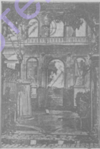
Отоманскій банкъ въ Бейрутѣ въ который попалъ снарядъ изъ итальянскаго крейсера во время послѣдней войны.