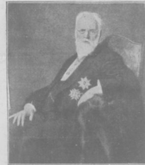
Принцъ Людовикъ, Наслѣдникъ Баварскаго престола, которому передаетъ отецъ принцъ Луитпольдъ регентство.