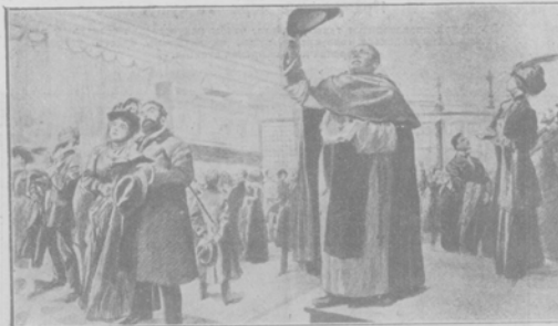
Осмотръ Сикстинской капеллы въ Римѣ.

По случаю производства въ чинъ полкника, и назначенія командиромъ 4-го Сибирскаго стрѣлковаго дивизіона и отбытія во Владивостокъ къ мѣсту служенія.