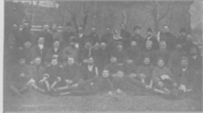
Гумена крестьянъ, съя трюмажи, Бюндераго места, вродимыхъ къ большае ульичае курсы вострадае съ промывае и лаваче-бонной конюшней.