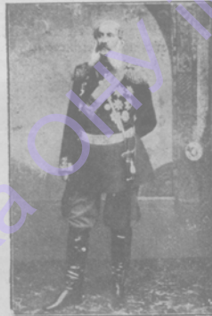
Генераль отъ-инф. Е. В. БОГДАНОВИЧЪ,

Принцъ Луитпольдъ—Карль-Йосифъ-Вильгельмъ—регентъ Баварій, третій сынъ короля Людовика I. Родился въ 1821 г. Принималъ участіе во Франко-Прусской войнѣ. Въ 1869 г. Луитпольдъ сдѣлался регентомъ Баваріи, вслѣдствіе душевной болѣзни своего племянника Людовика II. Остався регентомъ и послѣ смерти послѣдняго, въ виду душевной болѣзни короля Оттона I.