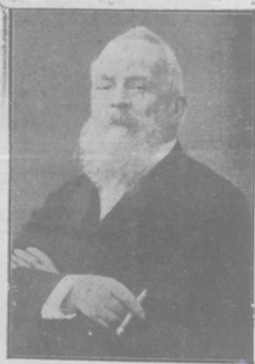
Принцъ Луитпольдъ, регентъ Баварскій, отказывающійся отъ регентства въ пользу сына.

Обоимъ полякамъ заточили патріарха въ Чудовъ монастырь, пріиславъ къ нему пристава, не позволивши переступить порога его кельи, и держали его въ острогѣ. Они объявили старшій лѣтнимъ, патріархаго достоинства. Вся русскія люди считали по прежнему патріархомъ Гермогена. Въ послѣдній разъ, въ январѣ 1612 года, поляки потребовали отъ Гермогена грамоты въ императорскую, чтобы они распустили все святое Патріархъ, какъ всегда, твердо и прямо заявилъ, что благословляетъ и жертордець и проливаетъ кровью. Страшавшій стѣнныи еще больше, его заключеніе. Онъ умеръ 17-го февраля 1612 года годномъ смерти. Мѣсто упокоенія патріарха—Чудовъ монастырь.