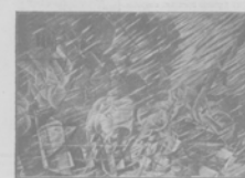
"Ты, кто уходишь, оставь меня".—Картина Гюберта Бюхмана.