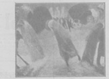
"Видъ изъ Театра".—Картина Карла Карра.