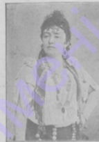
Симонъ или величества М. И. Давидъ Гера ево.