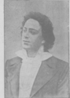
Симонъ Его Величества Л. В. Сибирскій. Къ концерту 20-го февраля въ Сибирь.