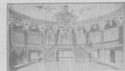
Декорации 2-го акта оперы "Добрый вѣстникъ", Раб. худ. М. В. Бессонова. (Къ спектаклю оперы въ театръ Сибирскаго).