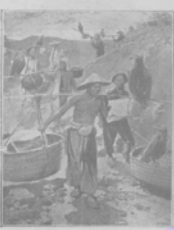
Орды, помогае китайскимъ рыбакамъ въ рыбной ловли.