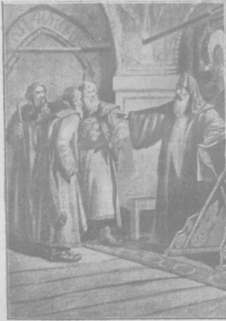
Патріархъ Гермогенъ и бояре.

Патріархъ Гермогенъ и словомъ и дѣломъ боролся противъ польскаго вторженія и вѣдьянъ, и вскорѣ чрезвычайно нагло выскандъ своей соборъ мѣстѣй. Представители польской партіи, съ бояриномъ Салтыковымъ во главѣ, сорвавши грамоты съ предсѣдѣнія: королю Сигизмунду отпустивъ королевича въ Москву, русскимъ послали у Сигизмунда, чтобы они отступили во всемъ на королевскую волю, и къ Пелому, чтобы они не собирали войска и не затѣвали востанія. Написавъ эти грамоты, они обратились съ требованіемъ къ Гермогену, чтобы онъ ихъ подписалъ, но патріархъ истрѣбавъ ихъ строго и рѣшительно отказавъ не подписать. Салтыковъ ставъ грозить захватить можемъ, но Гермогенъ обинявъ его крестнымъ знаменіемъ, сказалъ: Крестное знаменіе да будетъ противъ твоего беззавѣснаго ножа. Грамоты не подписаныя патріархомъ, дѣйствіе на нихъ имѣть не могли и польская партія пошла въ просакъ.