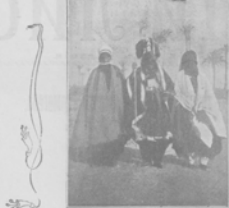
Видъ сцены въ театральномъ здании въ Одессе, съ изображеніемъ въ сценѣ въ пьесѣ "Смерть Шатана".