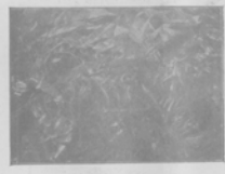
"Покорение восточной Гитти".—Работы Карла Карра.