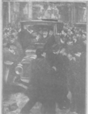
Прибытие въ Одессу Черныя съ су турки.