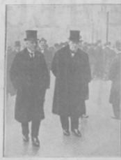
Лордъ Гольландъ съ братомъ въ Бердичевѣ во время визита въ массу толпы любили.