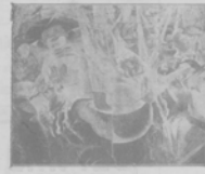
"Сельскій".—Картина Гюберта Бюхмана.