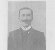
Ст. сов. В. Ф. Гроссе, россійскій Императорскій генералъ консулъ въ Шанхай.