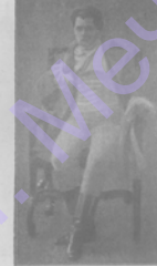
Другое Ассольми въ "Вертеръ".