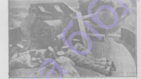
Ордыба изъ 6 действующихъ оружей по контръ-монстрамъ.