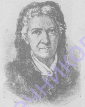
Графиня Елена-а Басилевна Селъ-де-Турмезе (Елена Туръ), крупная писательница. 0 годовъ. Къ 20-лѣтїю со дня смерти.