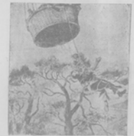
Гибель воздушнаго шара. Акриса „Танецъ“ была въ роли Лизы въ оперѣ „Сестры Саванна“ 10-го марта въ театру „Умолѣ“.