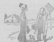
Небродило. — Я младше изъ сестеръ! — Небродило! Какъ же вы выглядите старше!