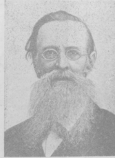
А. Н. МАЙКОВЪ. Къ 15-лѣтїю со дня смерти.