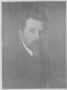
Импозиторъ А. Г. ГРЕЦАНИНОВЪ , въ театру съ его участіемъ 9-го марта въ „Умолѣ“.