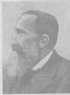
Иосифъ КРАШЕВСКІЙ, польскій писатель. Къ 100-лѣтїю со дня рождения.