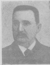
М. Шурбина, известный этнографъ и статисти- къ. Отправленъ на дѣлахъ въ Фхатериноваръ 40-лѣтїю науч- наго ури и дѣятельности.