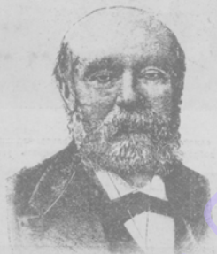
Поль Февале, французскій романистъ. Къ 25-лѣтїю со дня смерти.