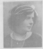
Д. де-БЕННИ , актриса въ театру 10 марта.