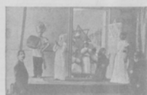
Живо картина „Три души“, поставленная во время театру А. Г. Гейдера во время литературного тура 23 февраля.