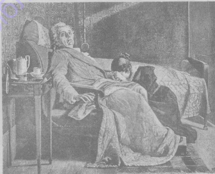
Последнія минуты Гете.