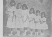
Шесть дочерей священника на сценѣ во время театру Днепроу-Донецкаго канала.