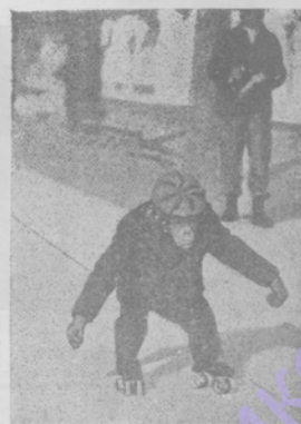
Знаменитая обезьяна «Консуль» на утренней прогулке в Ривьерь.