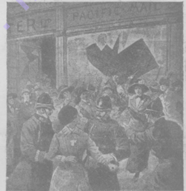
Аресты суффражистокъ во время беспорядковъ на Oxford street.