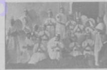
Канонъ картина „Сонъ Халла“, исполненная участниками театру А. Г. Гейдера во время литературного тура 23 февраля.