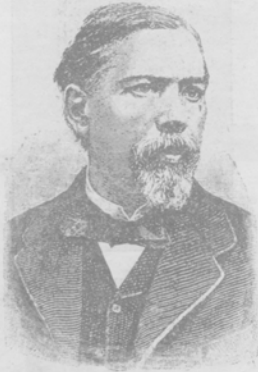
П. В. Анненковъ, писатель-критикъ. Къ 25-ти лѣтїю со дня смерти.