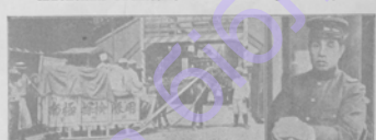
Сани сакузави на Токю-Сиднейской экспедиціи.