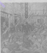
Грибникъ китайскаго вѣйскаго Виланду. Китайскій грибокъ Виланду французскій 10-го марта, первая модель, изображена при жизни на театру въ роли Лизы въ оперѣ „Сестры Саванна“ 10-го марта въ театру „Умолѣ“.