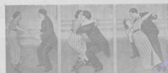
Новый американскій танецъ „Медвѣжья шкура“ .