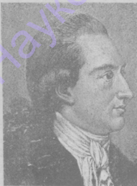
Гете по портрету 1779 года.