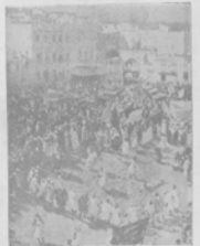
Религиозная пьеса посвященной сестры „Ганна“ въ театру.