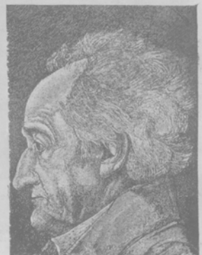
Гете на 77 году жизни въ 1826 г.