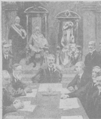
Новый генералъ-губернаторъ Канады герцогъ Коннаутскій съ друтей и членами канадскаго правительства съ премьеръ- министромъ во главѣ.