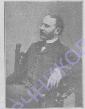
Графъ Куно-Гедервари, венгерскій министр-президентъ. Къ выходу изъ отставки кабинета.