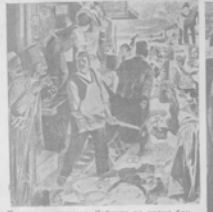
Взрывъ на улицахъ Бейрута во время бомбардировки итальянцами.