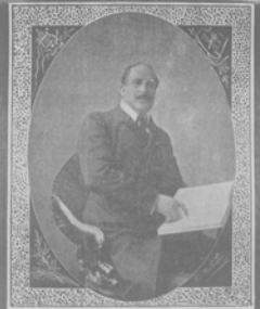
Маттия Баттистини. Къ гаспранъ въ Городскомъ театръ.