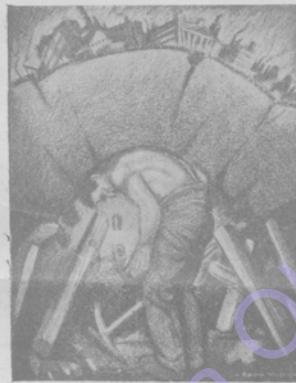
Кощмаръ революціи углекоповъ. Забастовка углекоповъ, нарушающая весь строй жизни Англии, рисуется многими въ образъ фантастическаго чудовища, грозящаго подорвать всю современную культуру и экономическую жизнь.