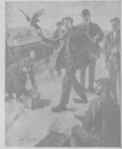
Утробы забавляются забавляются голубыми спорным (Тонка голубе).