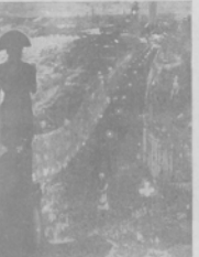
Демонстрация суффражистокъ на Trafalgar square въ Лондонѣ.