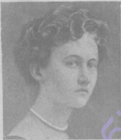
Первая вѣнцеская герцогиня. Исперши въ исторіи Европы послѣ смерти отца вступить на тронъ великаго герцогиня, Марія Ликсбургской, родившейся въ 1694 году. Будетъ править около 300 т. чело-