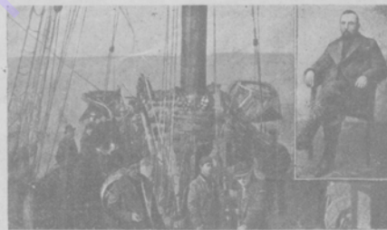
Къ открытію Южнаго полюса. Суэзо „Фрамъ“ и его экипажъ съ которымъ Амундсенъ открылъ Южный полюс. Справа портретъ Амундсена.