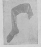
Утробы, записанный въ себѣ человека для бѣды своей.