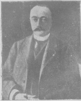
Н. В. Чарыновъ, русскій посолъ въ Константинополь, на- значенный присутствовать въ Сенатъ.