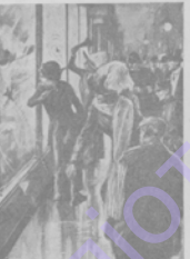
Суффражистки бьютъ себя на Oxford Street.