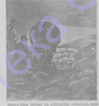
Лавина-гора мидя, въ мидянской мидянской провинции, мидянской провинции мидянской провинции.