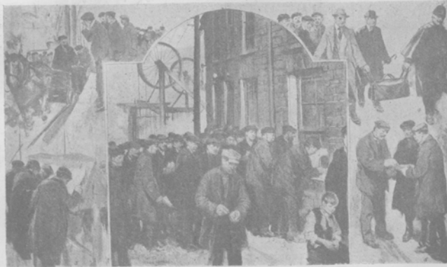
1) Рабочіе углекопы, получающіе свой послѣдній заработокъ послѣ объявленія забастовки. 2) Забастовщики поджидаютъ надъ тѣми углекопами, которымъ представлено поддерживать въ порядкѣ копи во время забастовки. 3) Забастовщикъ въ рабочей чалмѣ. 4) Уплата денегъ забастовщикамъ углекопамъ. 5) Сборъ денегъ въ пользу товарищей во время каменноугольной забастовки.