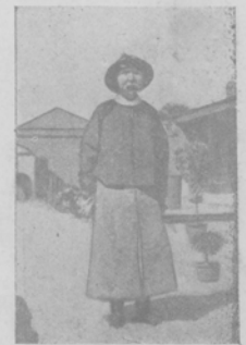
Чжаоэрсунь, вице-королева Манчуріи, единственный изъ вице-королей сохранившій вѣрность манчжурской династіи.