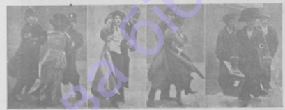
Артисты суффражистокъ, участвовавшихъ въ демонстраціи.