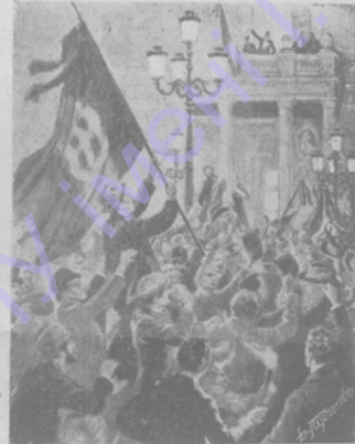
Энтузіазмъ въ Римѣ вызванный провозглашеніемъ въ парламентъ аннексіи Триполи.