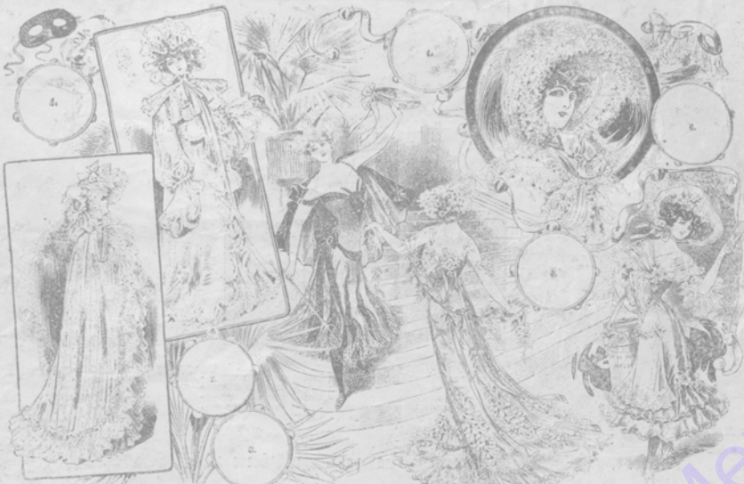
Изъ маскарадному сезону: дамскіе костюмы.

1. Роза ее шелковое домино, оди- навное подолки и рюшками изъ шелко- вого мусселина; воротъ домини завязывается розовой бархатной лентой съ винными концами. Шапочки изъ той же матеріи съ жемчужной пряжкой отъ сади. 2. Домино изъ желтого ат- ласа, покрытое толстыми твоями еі мушками и обшитое вышитыми оборками изъ того же твоя. 3. Костюм „Медисго“ изъ краснаго и чернаго мусселина вырѣзана фестонами въ видѣ зыбокъ, пламени и поделана на другую ниж- нюю юбку изъ чернаго вышитаго налетками твоя. Корсажъ изъ выш- вараса изъ палеювъ огненного цвѣта, отдѣланъ бархатными лентами и бар- хатной же головной алазола. Черни бархатная палица, подбитая нушно нѣмъ атласомъ. Рюшки изъ чернаго же. 4. Каноръ для въ срой и театра изъ буф-агаго голубого мусселина на кар- сашѣ. Спереди большой балтъ изъ бар- хатныхъ лентъ. 5. Костюмъ „Гандина“. Платье изъ шелковаго мусселина на атласномъ чехлѣ цвѣта глиц-ини. Ма- лонювъ бѣлого изъ бѣлаго-зеленаго лентъ образуеъ твоякъ, отуда вы- ходятъ букеты и длинныя вѣтви цвѣ- товъ. 6. Костюмъ „Продавщица розо- вей“. Платье изъ сѣра, серебристаго цвѣта, отдѣланное фино изъ бѣлаго мусселина заканчивающагося спереди букетомъ розъ. Крошечный шарикъ изъ мусселина съ кружевными шпур- станами. Гандина розъ на юбкѣ и на переднѣшѣ. Широкая шляпа изъ зеленой соломки съ розовыми лентами и пѣтвѣтвѣ. Въ рукахъ картонка въ окрытѣ разписаннаго, и лотъ оловъ съ надписью: „Vive le plaisir, mesdames et messieurs“.