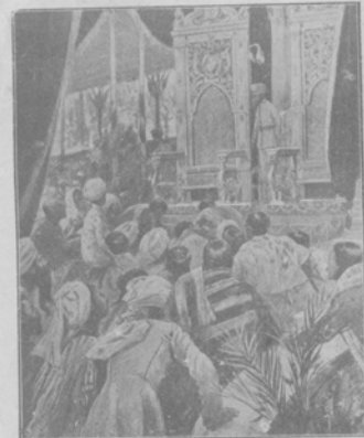
Толпа туземцевъ совершаетъ «риѣа» (т. е. обрядъ преклоненія) предъ трономъ, на которомъ сидѣлъ король Георгъ.