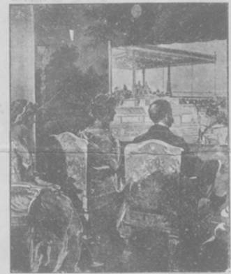
Англійская королевская чета смотритъ во время пребыванія въ Калькуттѣ картины бюскупа, изображающія разныя фазисы коронаціонныхъ торжествъ въ Дѣли.