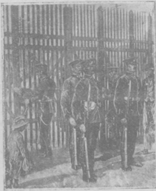
Запирание «Стѣлъ Геркулеса». — Въ Гибралтарѣ, англійской твердыни, сберегающей входъ въ средиземное море, каждый вечеръ прісходитъ торжественное запирание воротъ, послѣ чего всякое сообщеніе между англійскимъ укрѣпленнымъ городомъ и сосѣдней Испаніей до утра прекращается.

Разутъ въ англ. посольствѣ 12-го января, въ день прибытія въ Спб.