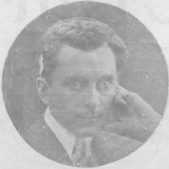
Б. О. ФРЕДМАНЪ-КЛЮЗЕЛЬ, известный скульпторъ.

Скульпторъ Б. О. Фредманъ-Клюзель и его бюсты артистовъ.