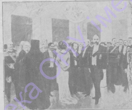
1) Адмиралъ Бересфордъ бесѣдуетъ съ морскимъ министромъ адмиралъ Григорьевичемъ. 2) Лордъ епископъ эскетерскій подѣ руку съ епископомъ алеутскимъ Иннокентіемъ. 3) Генералъ Муррей. 4) Китайскій посланникъ. 5) Премьеръ-министръ В. Н. Коковцевъ бесѣдуетъ съ лордомъ Уардлѣмъ. 6) Председатель Г. Думъ М. В. Родзянко. 7) Графъ С. С. Виттъ. 8) Генералъ Витонъ. 9) Англійскій посолъ сэръ Бьюкененъ. 10) Выши прескактель Г. Думъ А. И. Гучковъ. 11) Товарищъ председателя Г. Думъ кн. В. М. Волконскій. 12) Японскій дипломатъ съ супругой.