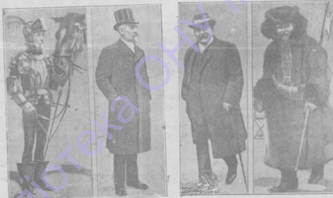
Донъ-Кихотъ.—Бетманъ-Гольвегъ. Ночной сторожъ.—Кидерленъ-Вехтеръ.

женія, въ которыхъ нѣмецкая публика дал- не всѣхъ узнала, хотя въ бычномъ в. эти дѣятели ей хорошо знакомы. Эт. Шерпонтъ Морганъ, президентъ Фальбер- германская кронпринцесса, Бетманъ—Го- вегъ и Кидерленъ Вехтеръ.