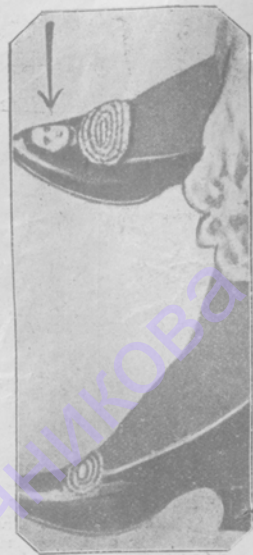
Причуды моды.— Въ Америкѣ наредѣтся новая мода—дамы Востока выходятъ на прогулку въ башмакахъ, украшенныхъ портретами своихъ поклонниковъ.