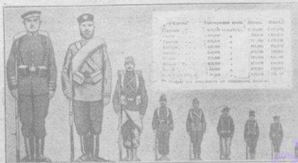
1) Германія, 2) Россія, 3) Франція, 4) Австрія, 5) Великобританія, 6) Италія, 7) Японія, 8) Китай, 9) С. А. Соед.-Шт.