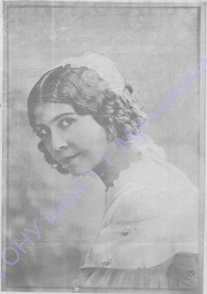
Артистка Императорскихъ театровъ Л. Н. ЛИПКОВСКАЯ (колоратурное сопрано). Къ предстоящему концерту въ Одессѣ.