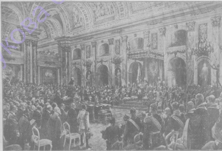
Императоръ Вильгельмъ говоритъ рѣчь во время торжественнаго заѣданія берлинской академіи наукъ въ императорскомъ замкѣ въ Берлинѣ, по случаю 200-лѣтня годовщины дня рожденія Фридриха Великаго.