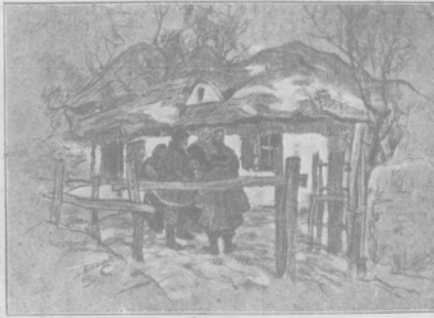
„Коляда на юг Малороссии.“ Рисунок художника-одессита, блестяще окончившего академію художеств, Ст. Ф. Колесникова.