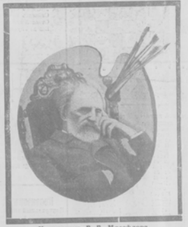
Художник Г. Г. Мисождов. (1908 года).