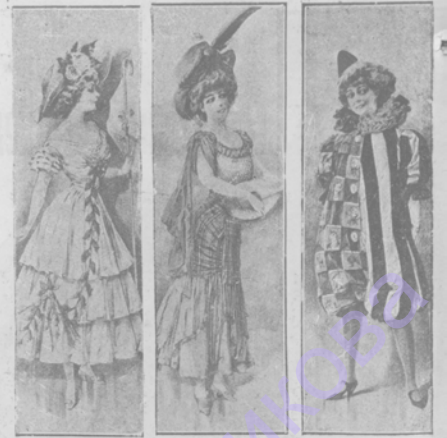
Последняя мода в области международных гардербов.