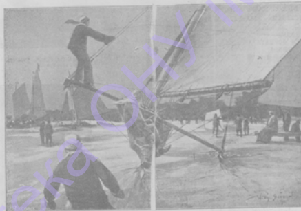
Деталь по льду на бортовой по льду в г-ростях Берлина.