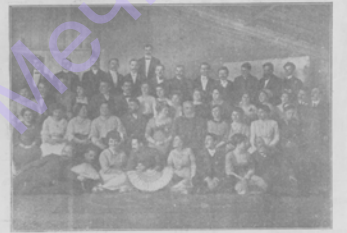
Группа гг. членов Одесского фотографического общества и их гостей, снятая во время празднования 20-летия существования этого общества.