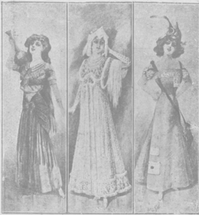
Последняя мода в области международных нарядов.