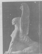
Скульптура Вана Милошевича.