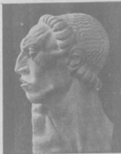
Скульптура Вана Милошевича.