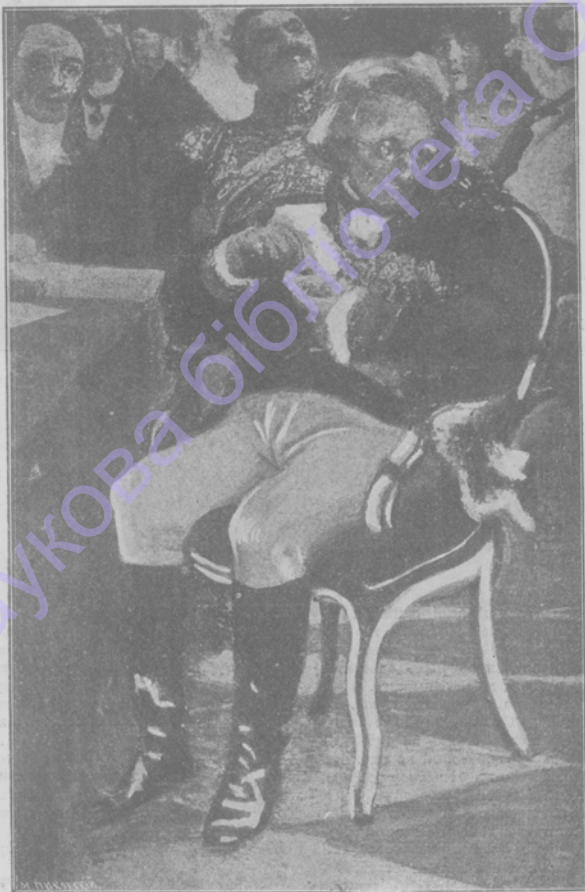
Свѣтл. кн. Н. И. Салтыковъ.

ПУШКИНЪ НА ЭКЗАМЕНѢ 8-го января 1815 г. (переходнаго въ старшій классъ).