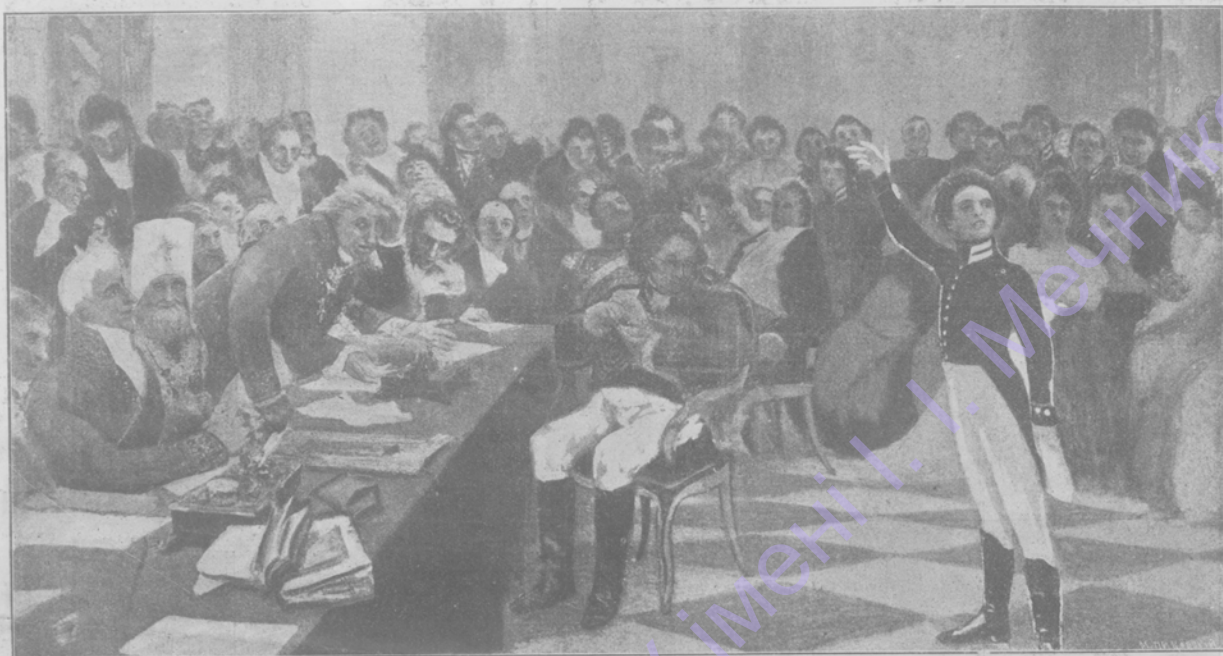
Гр. А. К. Разумовскій, Филаретъ, (Мин. нар. просв.)

(„Гвоздь“ выставки передвижниковъ, открывшейся 26 декабря въ Историческомъ музеѣ въ Москвѣ).