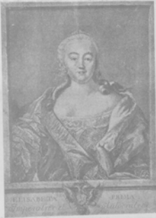
Императрица Елисавета Петровна. Съ 150-летия со дня смерти (123-го декабря 1761 г.).