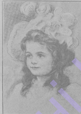
Велкая Княжна Марія Николаевна.