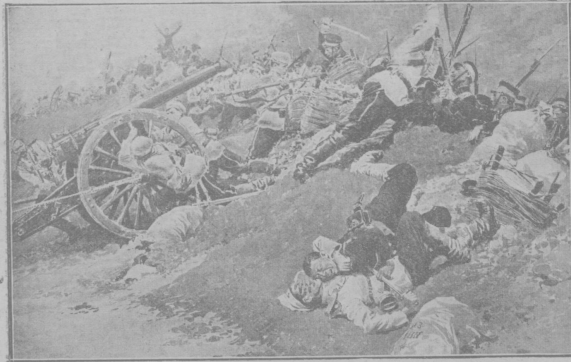
Штыковой бой у Портъ-Артура.