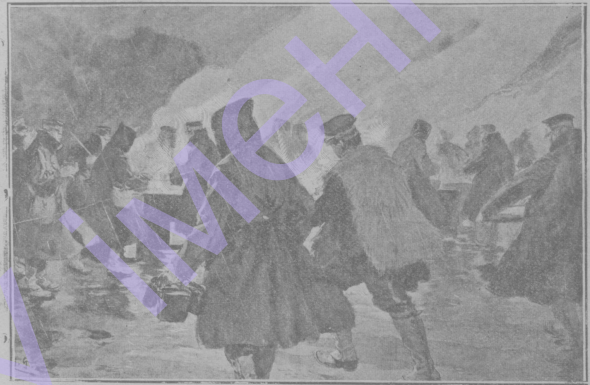
Японская полевая кухня въ метель.