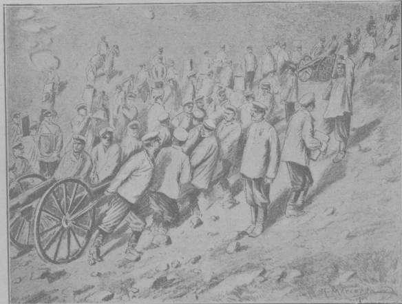
Вь Портъ-Артурь.—Артиллеристы втаскиваюь орудия на передовыя позиции, расположенныя на вершинахъ горъ, окружающихъ Портъ-Артурь.