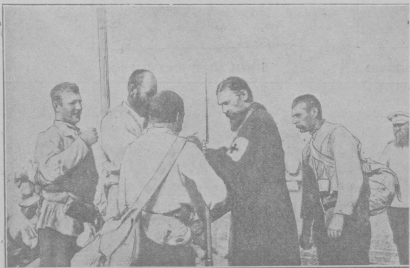
Приращение солдат перед боем.