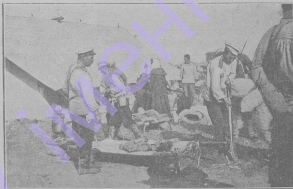
Погребение на месте кончины.

После сражений бываюь случаи, когда тяжело раненые умираюь на носилках, прежде чьм их успьют доставить в госпиталь. Тут же роюь яму и отпускаюь в нее тьло.