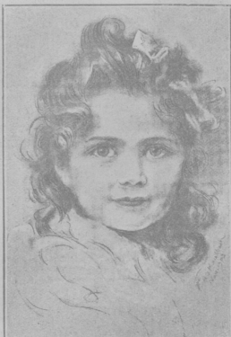
Велкая Княжна Татьяна Николаевна.