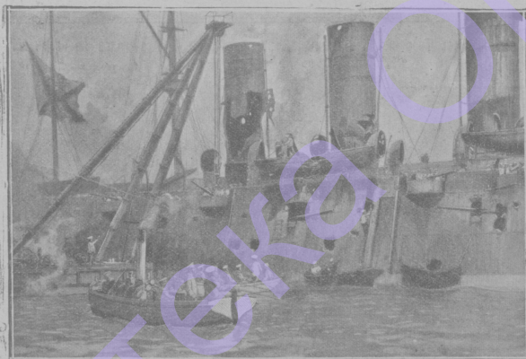
„Россия“ во Владивостонской гавани.

После сражений бываюь случаи, когда тяжело раненые умираюь на носилках, прежде чьм их успьют доставить в госпиталь. Тут же роюь яму и отпускаюь в нее тьло.