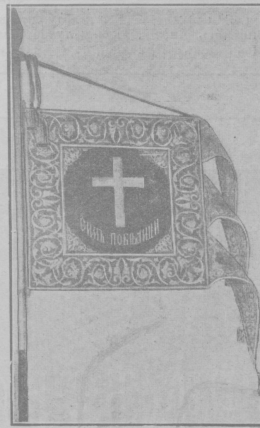
Стагъ, поднесенный командующему 2-й манчжурской арміей генералъ-адъютанту Гриппенбергу отъ населенія города Вильмы.