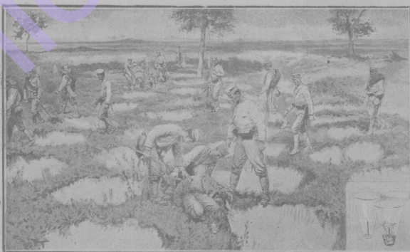
Семь дней вь волчьей ямь.

Розыскивая посль сражения у Шахе вь галляхъ „безъ ясти пропавшихъ“, японскыя санитары наткнулись на одну вьзачь яму, вь которой наши солдаты, пролежавшия нѣскозь и посль семидневнаго поста оставшагося вь живыхъ. Справа—схематическй чертежъ волчьей ямы до и посль падения вь нее