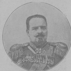
Ген.-лейт. к. В. Церпицкій, назначенный командиромъ 10-го армейскаго корпуса.