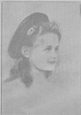
Велкая Княжна Ольга Николаевна.

Съ портретовъ знаменитаго иѣмецкаго художника Каульбаха.