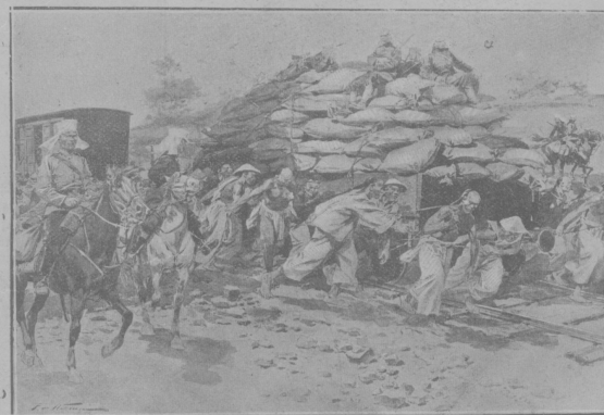
Доставка для японцевъ провѣанта по жельзной дорожь безъ паровозовъ.

Розыскивая посль сражения у Шахе вь галляхъ „безъ ясти пропавшихъ“, японскыя санитары наткнулись на одну вьзачь яму, вь которой наши солдаты, пролежавшия нѣскозь и посль семидневнаго поста оставшагося вь живыхъ. Справа—схематическй чертежъ волчьей ямы до и посль падения вь нее