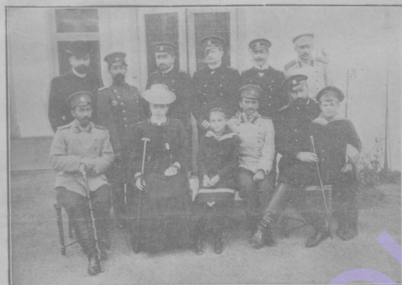
Велкій Князь Александръ Михайловичъ и Велкая Княжна Ксения Александровна съ Августѣйшими Дѣтьми въ группѣ раненыхъ, находящихся на излѣченіи въ Ай-Тодорѣ.