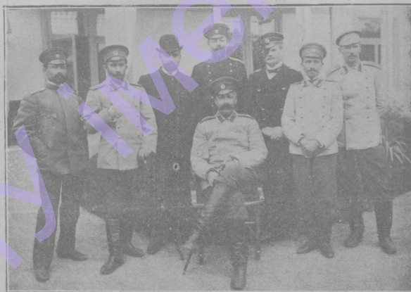
Велкій Князь Георгій Михайловичъ въ группѣ раненыхъ, находящихся на излѣченіи въ Ай-Тодорѣ.