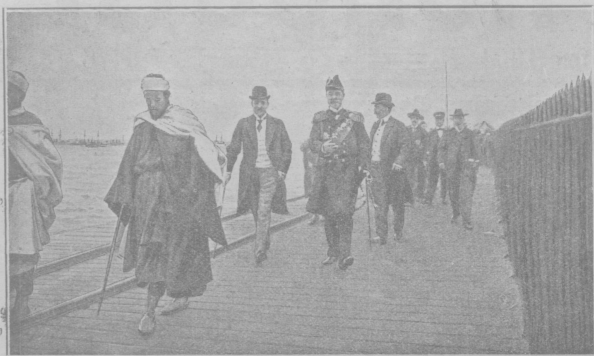
Адмирал Рожественский, в сопровождении русского консула в Танжерь, отправляется делать визит марокканскому султану