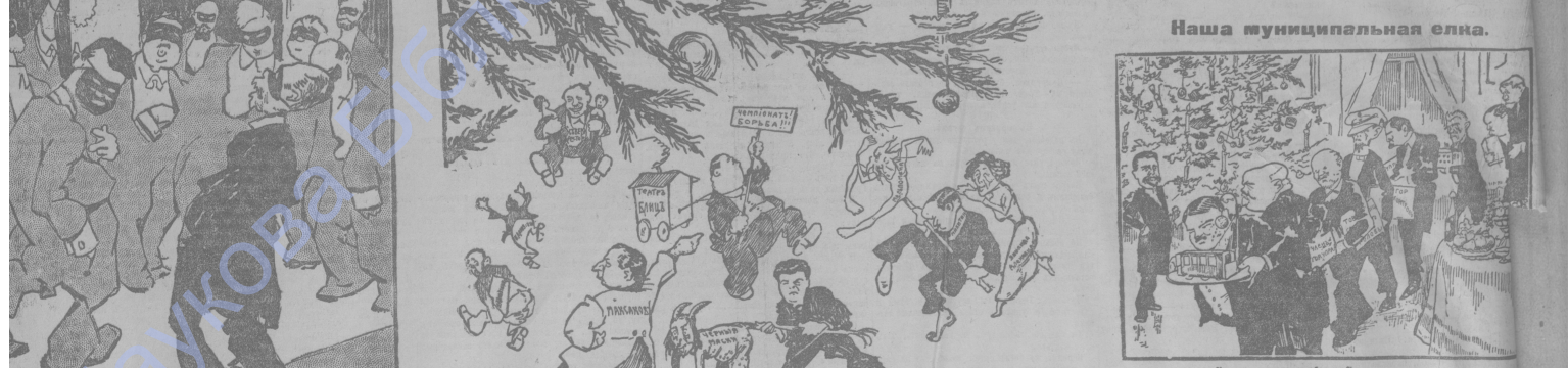
Наша театральная елка.